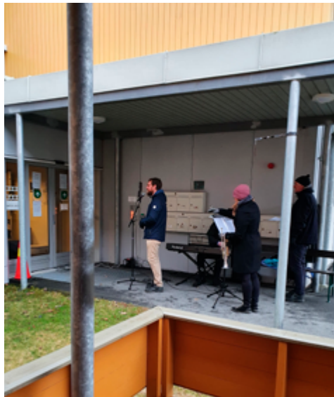
Friluftsandakt ved Hegra Bosenter