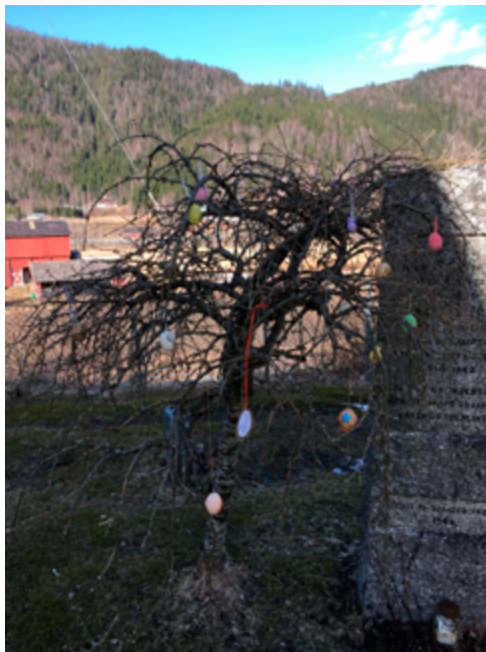
Håpstreet i Flora