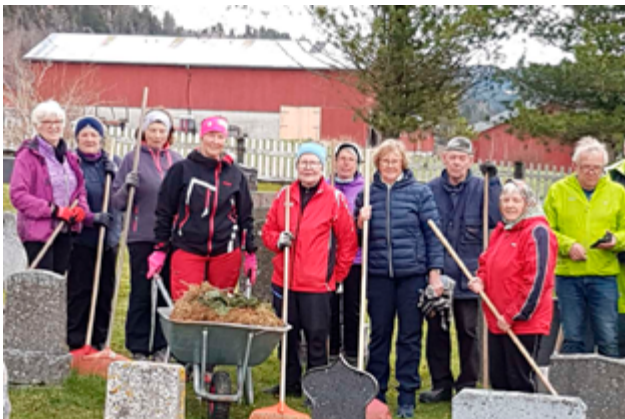
Dugnadsgjengen møtte tallrikt opp, og gjorde en flott innsats med å få ryddet etter vinteren rundt Okkelberg kapell