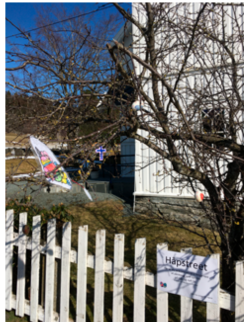
Håpstreet i Okkelberg