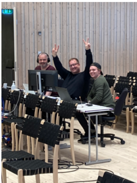
Teknikerteamet var absolutt nødvendig for å i det hele tatt få til dette og gjorde en kjempejobb