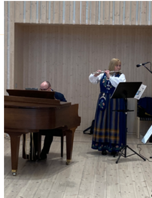
Fra opptak til 17. mai-andakt