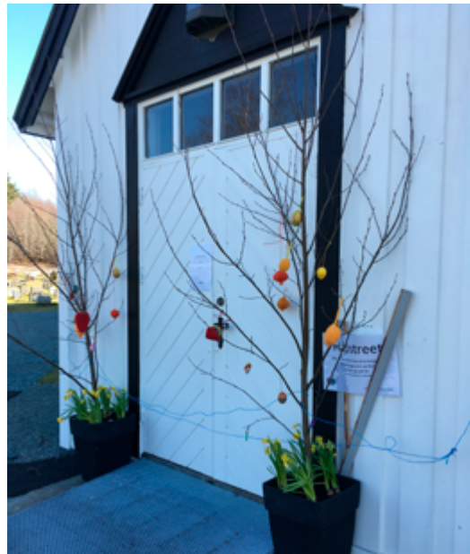
Håpstreet i Hegra

Og så har mange i menigheten gjort en stor innsats med telefonen i disse månedene. Svært mange har tatt noen ekstra telefoner rundt om, for å høre hvordan det står til og for å slå av en prat, når det ikke var mulig å møtes.