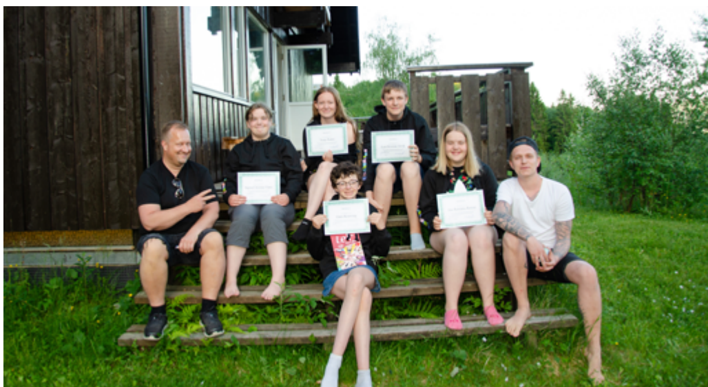
Deltagere på lederkurs i Meråker

Kanskje du er konfirmant i år, og har vurdert å gå på lederkurs? Ta kontakt med en av oss på kontoret! 😊