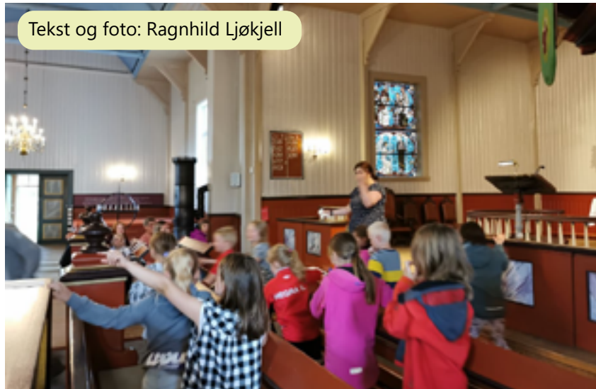
Tekst og foto: Ragnhild Ljøkjell

Da var dagen kommet! Frivillige og ansatte hadde rigget klart for Tårnagent 2021 utenfor Hegra kirke torsdag 24. juni 2021. Spente skulle vi arrangere i korona-vennlig versjon i to timer. Presis kl 16:30 kom det ryende 12 stk blide og forventningsfulle barn! En skikkelig trivelig og engasjert gjeng.