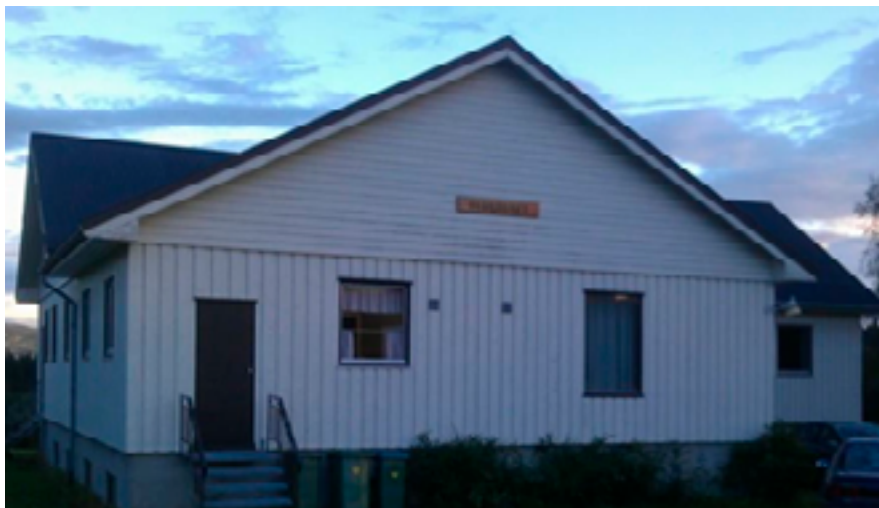
Det nye bedehuset, bygd i 1982-83