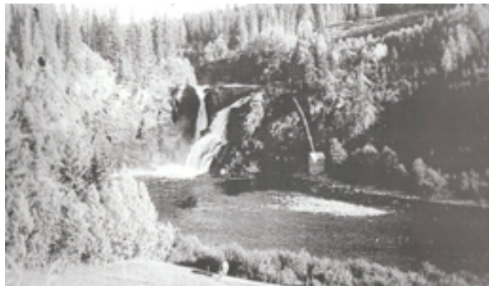
Kraftverket i Storfossen som Meraker Brug bygde i 1951/52

Ved instalasjon måtte man velge fast strøm. Her heime hos oss hadde vi 1700 kw fast, og hvis vi