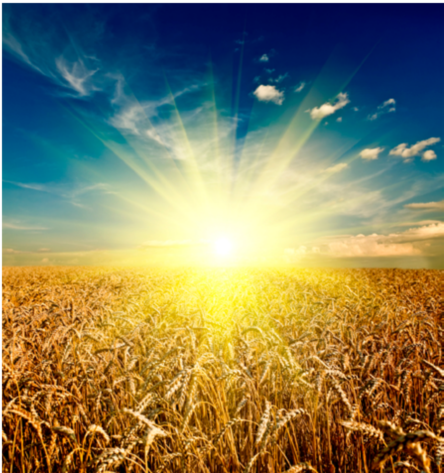
Med ønske om en rik høst for alle høstarbeidere!

Da svarte Jesaia, og la det også bli ditt og mitt svar: “Herre her er jeg, send meg”