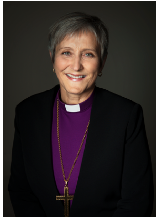
Herborg Oline Finnset, biskop i Nidaros.