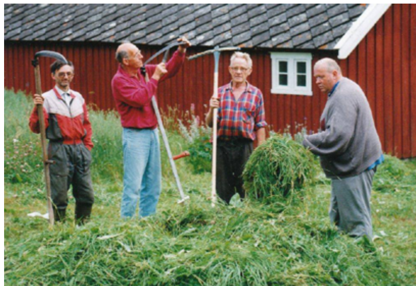
Bildet viser slotånn ved Kirkestallen