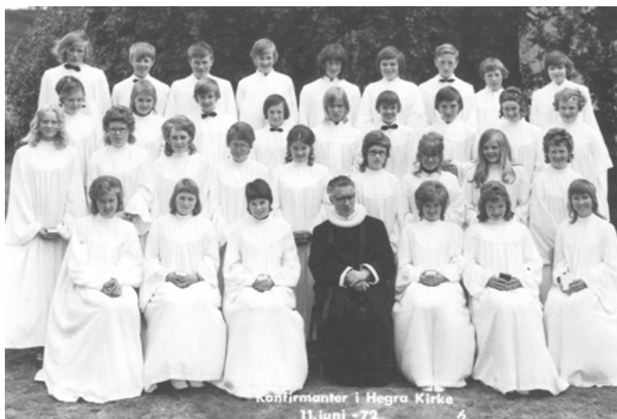
Foto: "Konfirmanter i Hegra 1900-2018"

I Hegra kirke er det presentasjon av konfirmanter og jubileum for 50-årskonfirmanter søndag 25. september kl 11.00