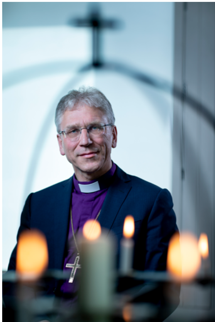
Biskop i Nidaros og preses Olav Fykse Tveit

Det finst ikkje eit lett vint svar på denne sida av det verkelege livet. Men jula minner oss om at det er noko meir enn det vonde som er verkeleg.