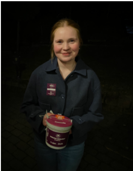
Tekst: Eva Buan

Årets fasteaksjon ble gjennomført i mars. Konfirman- tene gikk fra dør til dør og samlet inn 20.492 kroner til Kirkens Nødhjelp i kontan- ter!!!