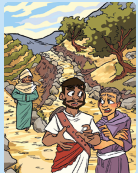
Tegning: Faye Simms

Her viser Jesus seg etter at han døde og stod opp igjen. De to bildene er nesten helt like, men kan du finne fem feil på bildet under?