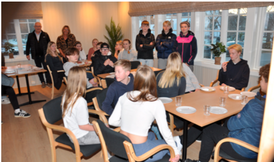
Medhjelpere og brukere av menighetshuset gleder seg til å ta i bruk de nyoppussede lokalene

Nå gleder vi oss til å ta peisestuen i bruk til samlinger og arrangementer – en stor takk til alle som har bidratt!