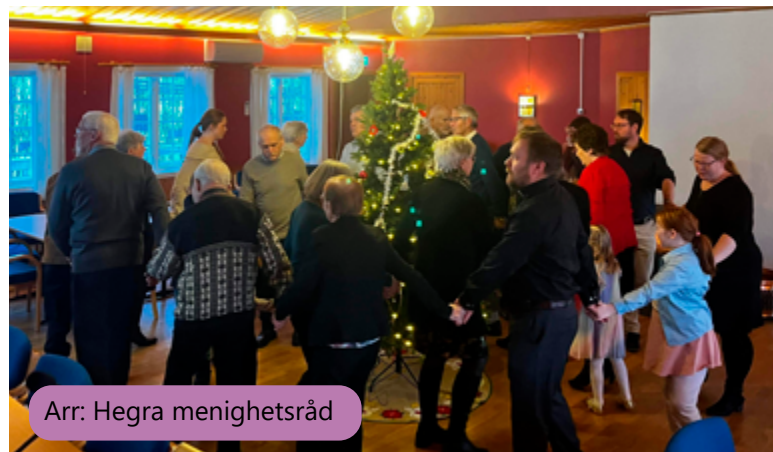
Arr: Hegra menighetsråd

Vi ønsker små og store hjertelig velkommen!