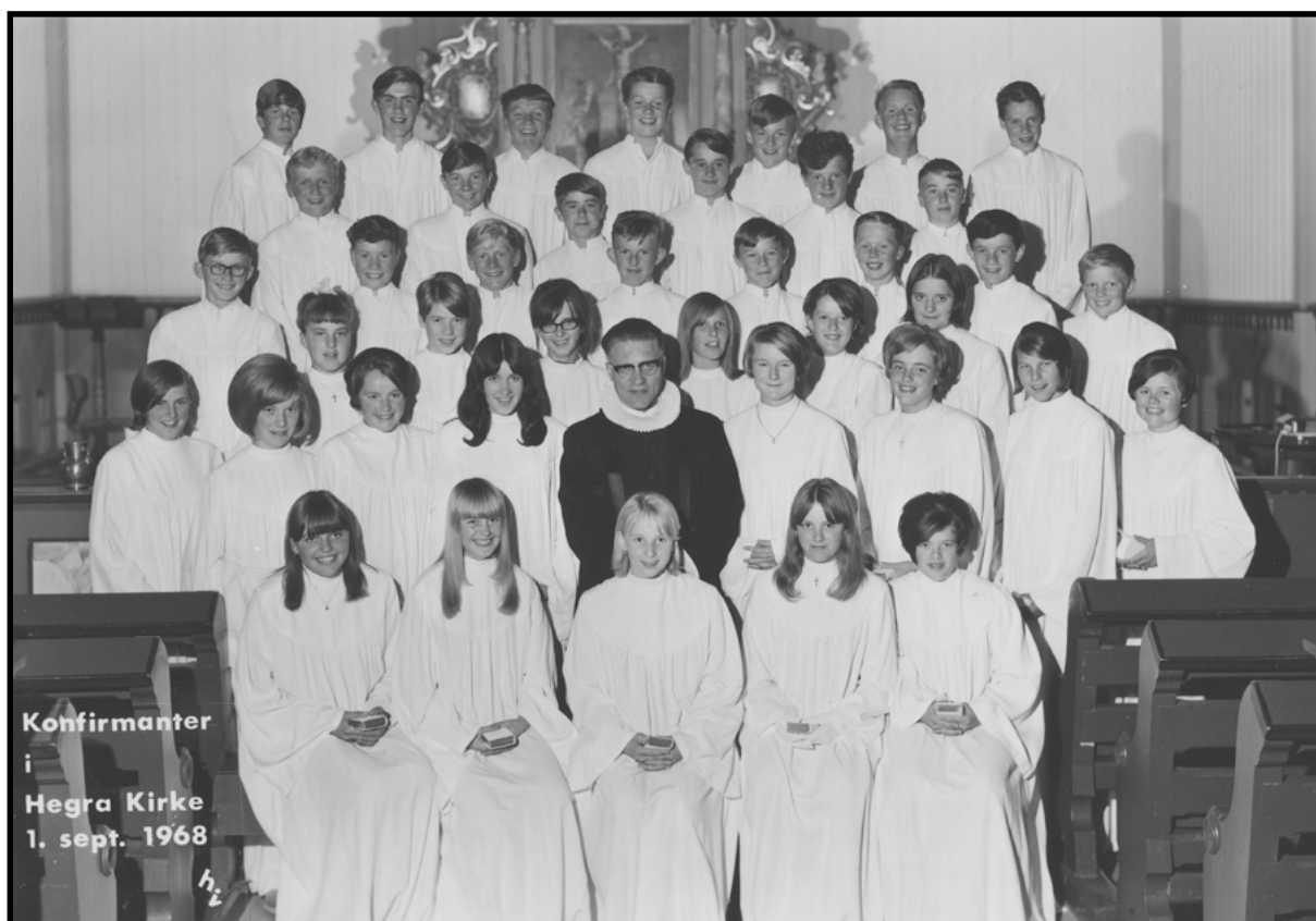
Hegra kirke 1. september 1968 - Floren kapell 8. september 1968