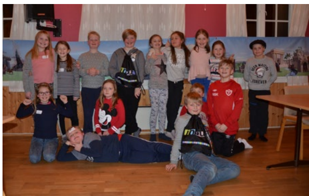
4. og 5. Klassinger fra alle bygdene var samlet til BB- kahoot

Mandag den 15. januar var det stor stemning i menighetshuset i Hegra.