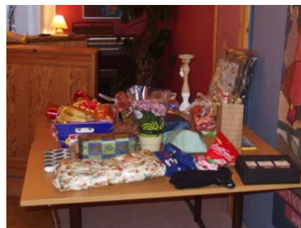
Mange flotte gevinster klar til å bli fordelt på ivrige loddkjøpere.