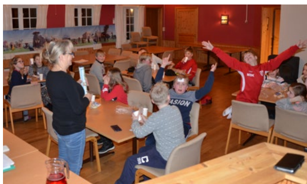
Kahoot (quiz) på nettbrett