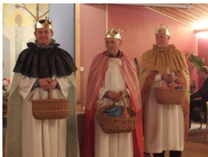
Årets tre konger med nye uniformer for anledningen