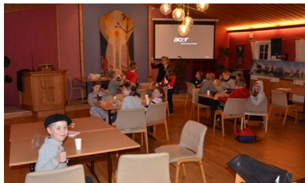
For å bli bedre kjent har alle først en økt på kjøkkenet og baker muffins, som selvfølgelig blir spist på slutten.