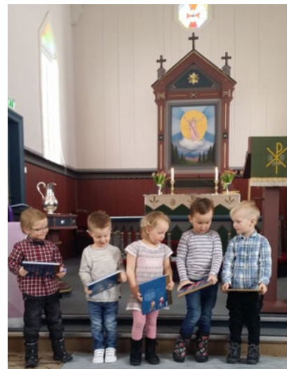
Okkelberg kapell 18. mars