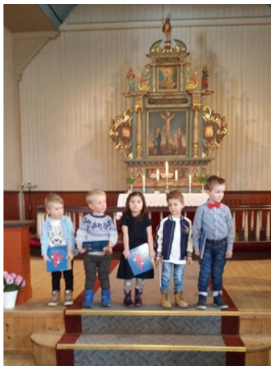
Hegra kirke 11. mars