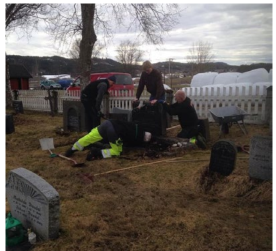
Flere gravstøtter ble rettet opp.