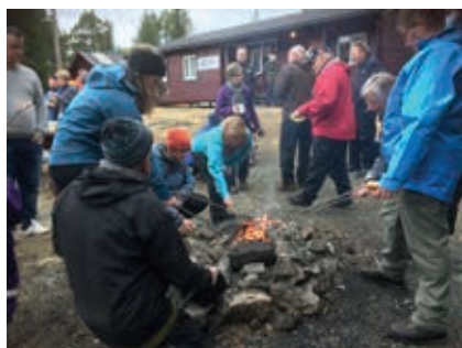
Fra grillingen etter gudstjenesten på palmesøndag 2017.

Palmesøndag, 25. mars kl. 1200 feirer vi gudstjeneste på Skihytta ved Frigården. Etter gudstjenesten blir det pølsegrilling og tid for en trivelig prat.