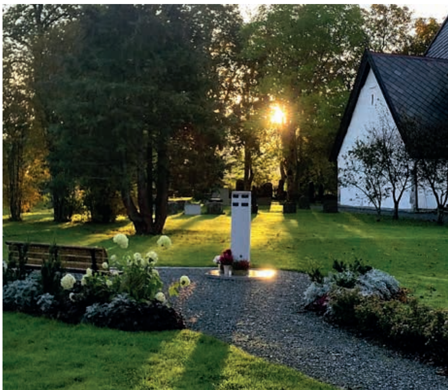
Den navnedde minnelunden ved Værnes kirke er et godt sted å sette seg ned for å minnes.

I løpet av 2018 vil det være navnet minnelund på kirkegårdene i Skatval, Hegra, Lånke, Elvran og Værnes.