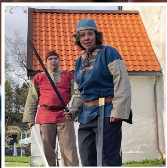
Heilsidebilde, Nattverd med barn, foto: Bo Mathisen / Bilde venstre: Logo Tårnagent TV, design: trusopplærer Geir Harald Eikrem / Høgre bilde: Innspeing av Tårnagent TV på Giske, foto: diakon Ingvild Snipsøyr