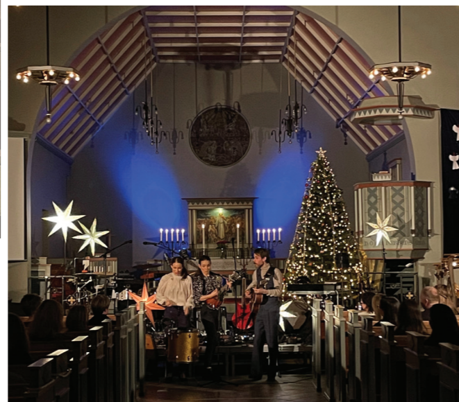
Bilde øvst: Gudsteneste frå Langevåg kyrkje Bilde nedst, Julekonsert med Garness