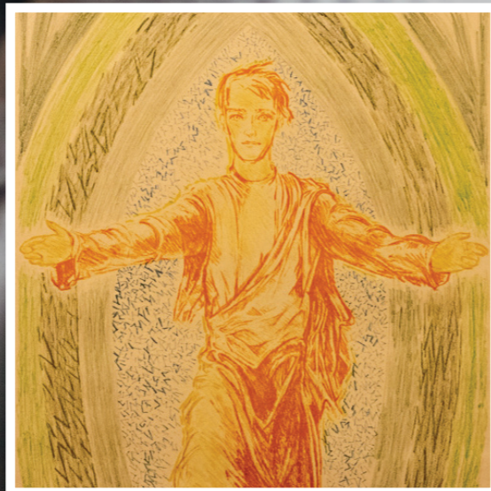
Heilsidebilde / Bilde venstre: open kyrkje frå Langevåg kyrkje / Høgre bilde: Utsnitt av detalj i utsmykking Indre Sula kyrkje