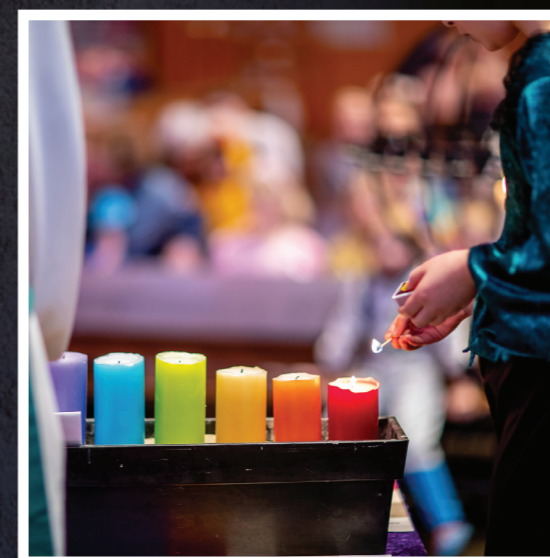
Detalj bilde frå Langevåg kyrkje Lite bilde illustrerer tenning av fastelys i fastetida