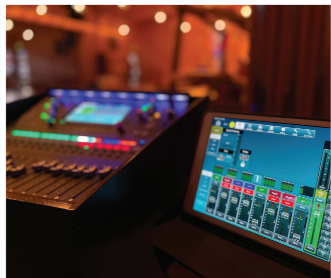
Bilde av kyrkjetårnet Langevåg kyrkje / Venstre bilde, lydanlegg i Langevåg kyrkje / Høgre bilde, lydanlegg i Indre Sula kyrkje