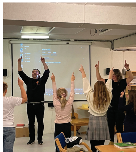
Bilde over: Trusopplæring i mange former - 4.klassesamling og utdeling av 4-klasse bibel. Søndagsskolen har samling og formingsaktiviteter. Det er gøy å lære nye sangar med fin rytme og bevegelsar.

Trusopplæringa i 2021 vart som alt anna prega av pandemien, og mykje av tiltaka har vi måtte avlyse. Året starta med full nedstenging i januar og det vart nødvendig å vidareføre digitale tilbod.