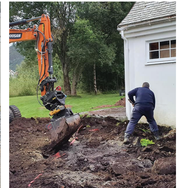
Bilde over: Dugnadsgjengen “Venner av Langevåg kyrkje” - har i 2021 drenert godt rundt kapellet i Langevåg - fylt på med pukk og grus. Fleire store graner er blitt felt, og vindauga restaurert. Bilde under: Rehabilitering og utviding av Indre Sula kyrkjegard - Indre Sula kyrkjegard vart gjenstand for ei stor rehabilitering og utviding i 2021. Gravplassen er utvida med 3 kistefelt, 1 urnefelt, og ei namna minnelund. Prosjektet fortsett i 2022, og skal ferdigstillast til sommaren 2022.