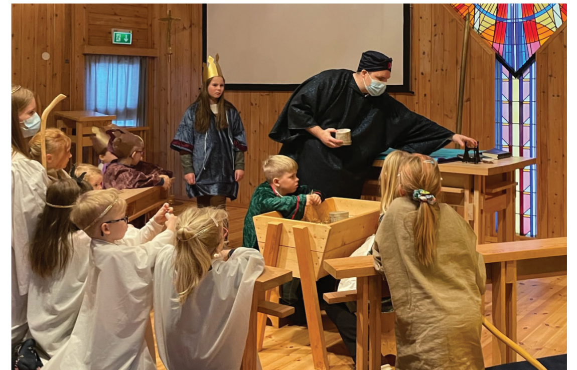
Bilde over: Julevandring for søndagsskulen - Utkledning og rollespel for søndagsskulen da dei fekk komme i kyrkja og få vere med på julevandring og få oppleve historia om då Jesus vart fødd. Dei fekk også helse på dei tre vise menn frå Austerland. Engasjerte born, flott musikk og gode formidlarar.

Det er eit håp at dette vert siste året der pandemien set ein stoppar for at barn og ungdom får komme til kyrkja.