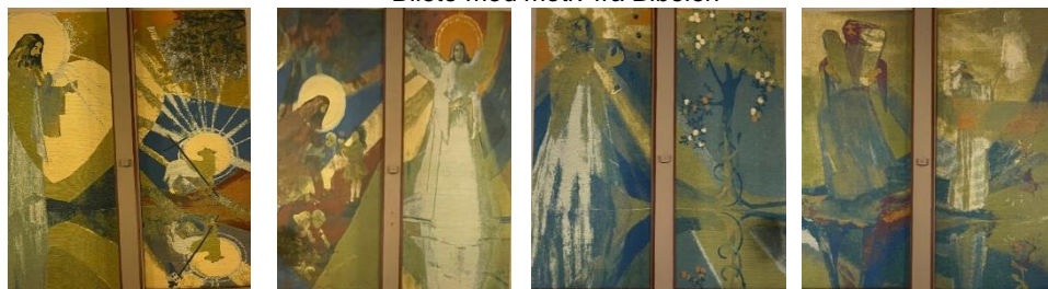
Bilete med motiv frå Bibelen