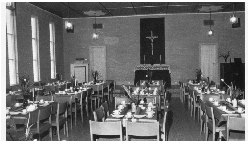
Berg kirke, trolig fra åpningen i 1972