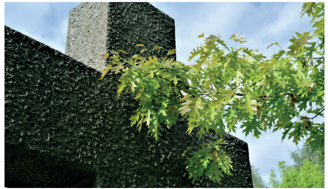
Korspyrd: Løvet på det grå granittkorset blir rødt til høsten. Dette er en litt uvanlig rødeik.

- Noen treslag var visst viktigere for forfedrene våre enn andre? - Helt klart. Bare tenk på den norrøne skapelsesberetningen: De