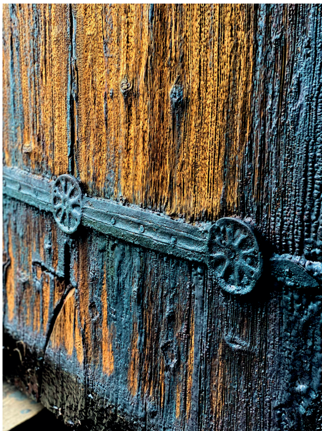
Haltdalen Portal: Detaljbilde av Haltdalens portal, som før var en del av Ålen stavkirke før den ble revet.