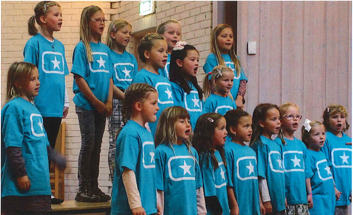
Byåsen Pre-soul Children