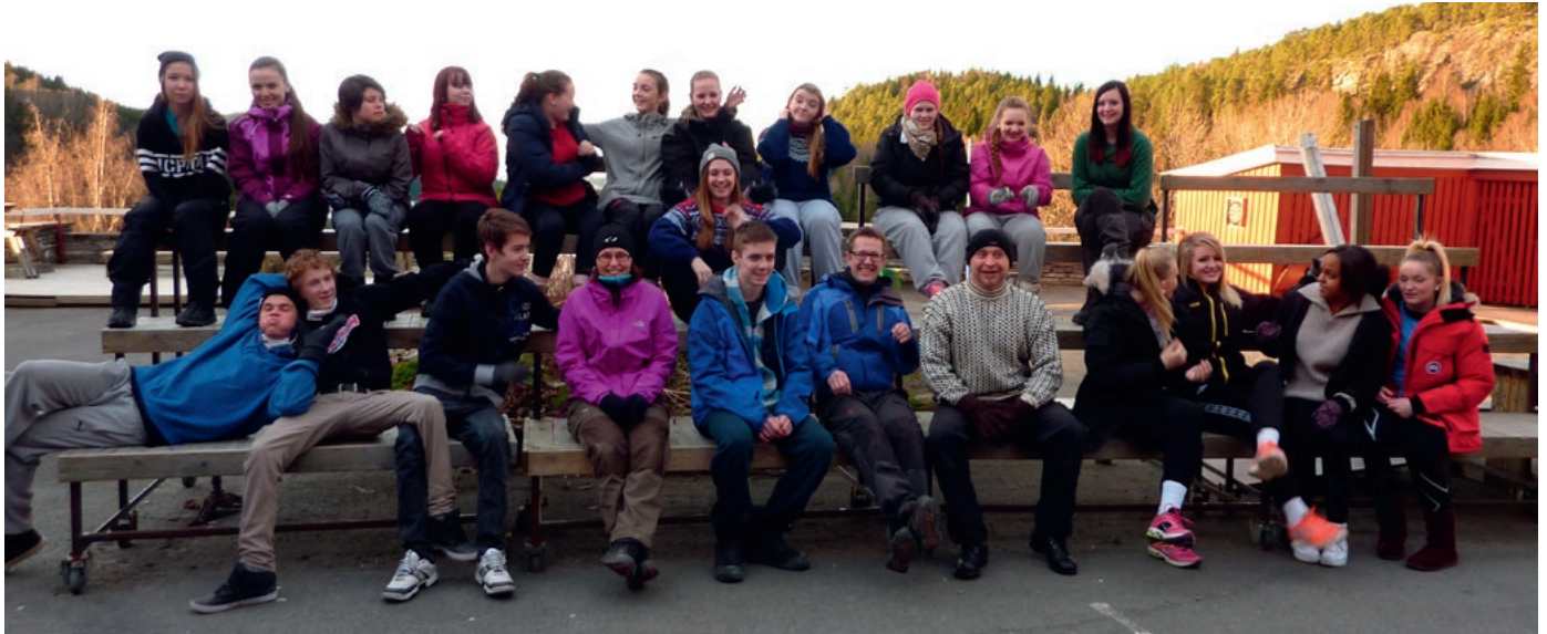
Fra felles weekend på Solhaug.

Vinteren 2013-2014 er det gjennomført Lederkurs for ungdom på Byneset og Leinstrand. Vi har hatt en flott gruppe som har lært om lederidentitet og hvordan lede, fått prøvd seg som ledere på arrangement for barn samt planlagt og gjennomført en gudstjeneste for ungdom. Høydepunktet på kurset har vært