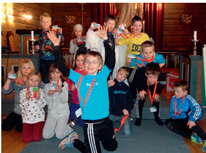
Vi er Tårnagenter.

Fredag 31. januar ble det arrangert Tårnagentdag for 3. klassingene på Byneset og Leinstrand i Leinstrand kirke. Skolen hadde stengt denne dagen. Ei flott gruppe agenter deltok på en spennende dag med skattejakt i kirka, kodeløsning, og utforskning av kirketårnet og andre bortgjemte steder i kirka. De ble kjent med kirkerommet, kirkegården og fortellinger fra Bibelen. Flere av barna deltok også med tekstlesing og dramatisering av fortellingen om Sakkeus på gudstjenesten søndag 2. februar.