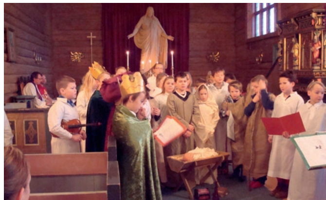
Ivrige elever ved Spongdal og Nypvang skole dramatiserer juleevangeliet.