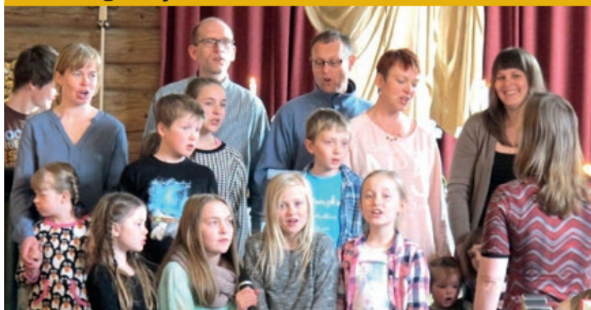
Byneset familiekor deltok med glad sang.