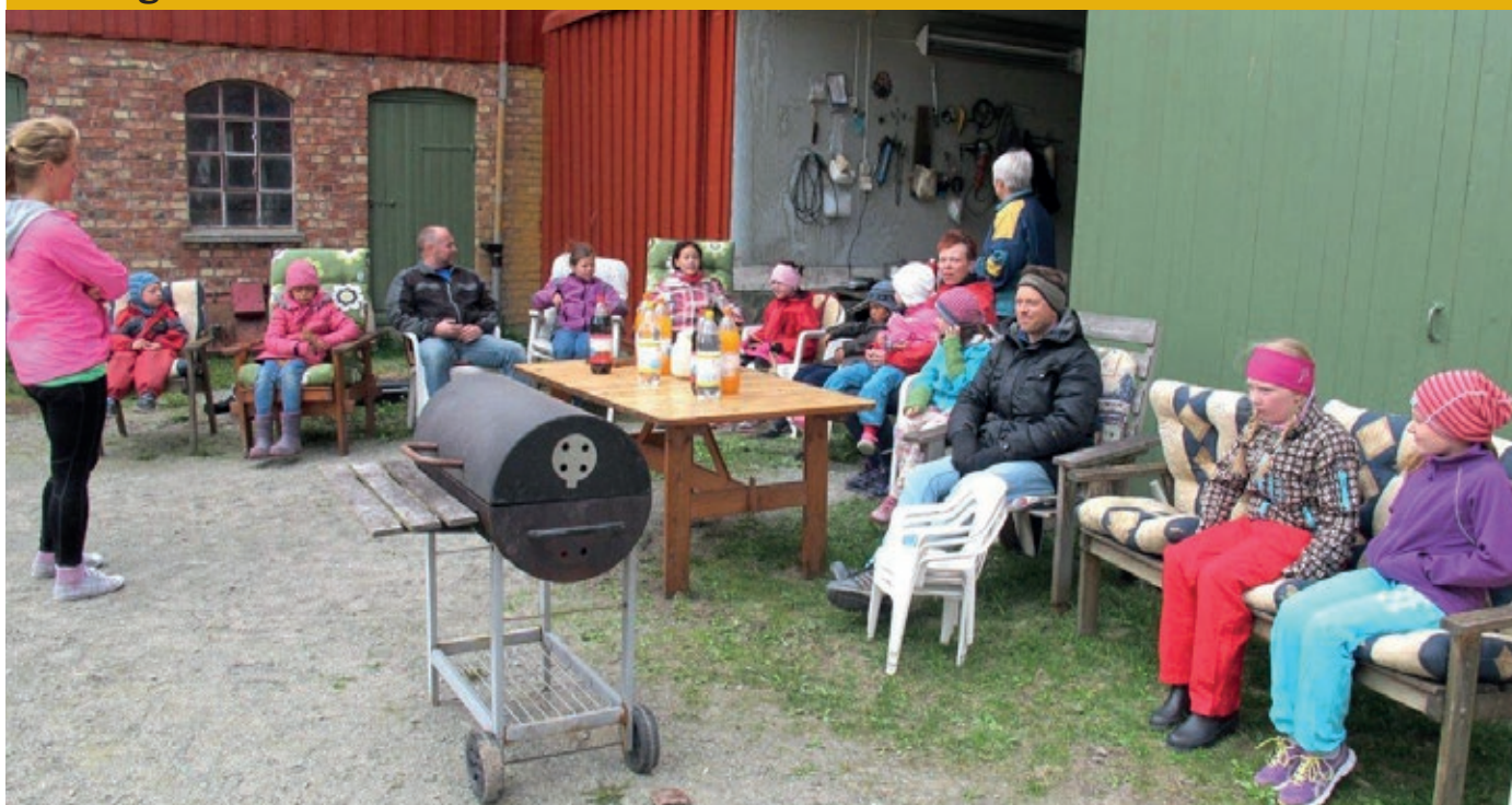
Populær avslutning i Onsdagsklubben på Leinstrand.