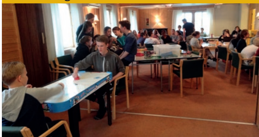
«Fusion» samler fullt hus på Berg bedehus annenhver fredag.