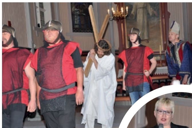
Golgata: På Golgata med inskripsjonen over hodet: «Dette er Jesus, jødernes konge.»