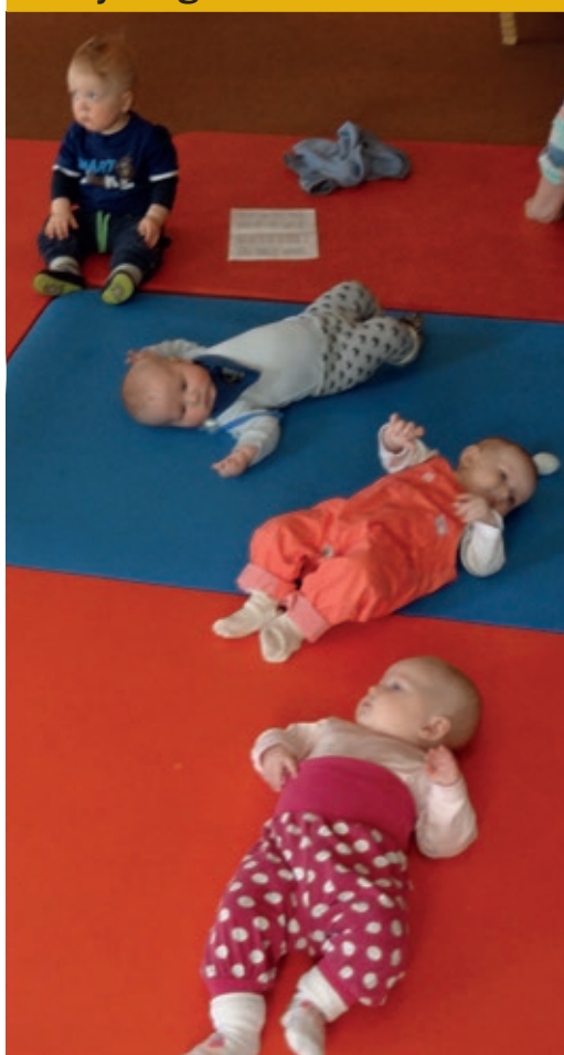
Annenhver mandag hygger babyene seg med sang på Berg bedehus.