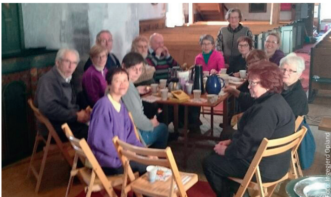
Byneset Bygdekvinne lag bretta opp ermene, tok med seg bøtter og kluter og stilte opp i kirka 8. mars. Sammen med noen stødige medhjelpere ble dette en formiddag alle så nytten av. God mat og kaffe hører med!