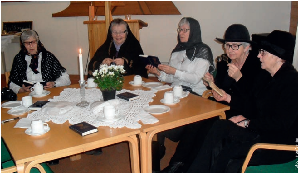
Berg bedehus 100 års-jubileum. Kvinneforeningen for 100 år siden.