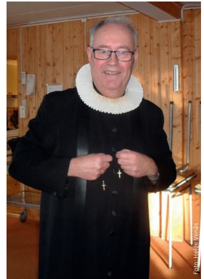
Den gamle soknepresten kom også på besøk.