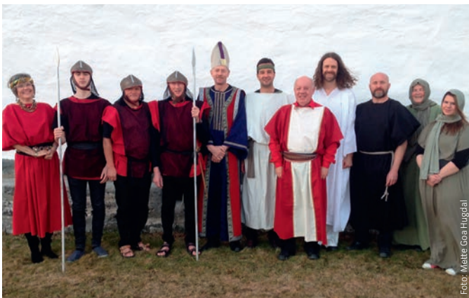
Aktørene i Pasjonsspillet Langfredag i Byneset kirke