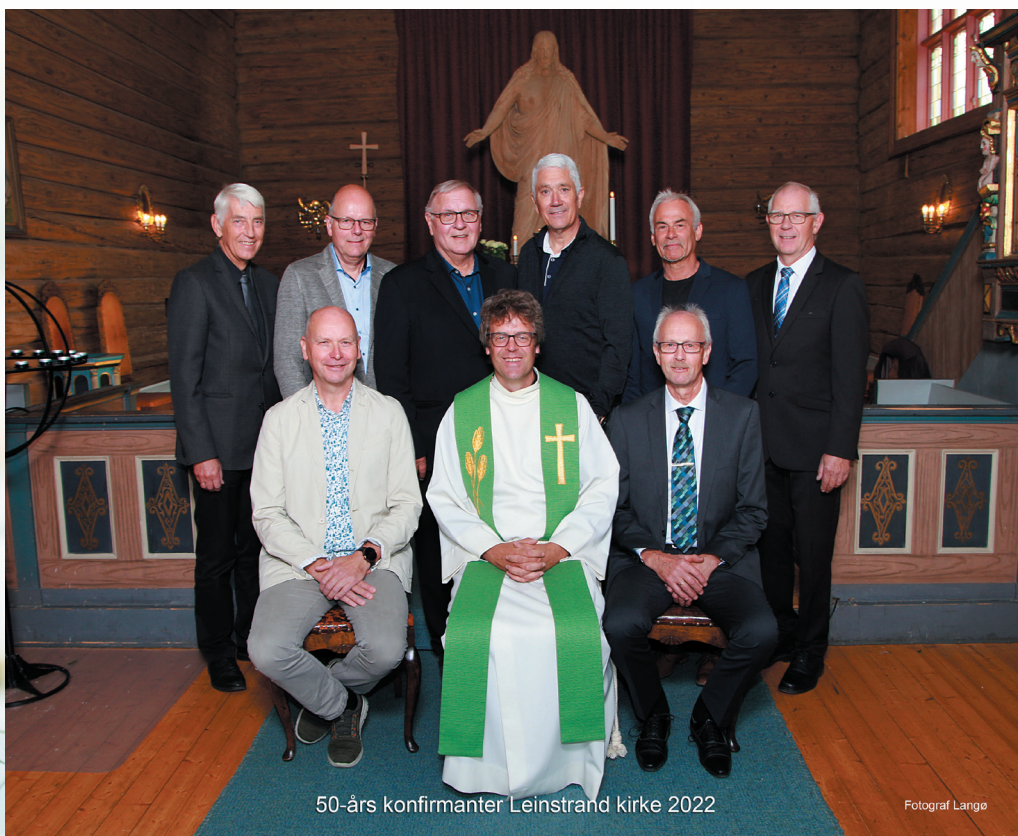
50-års konfirmanter Leinstrand kirke 2022