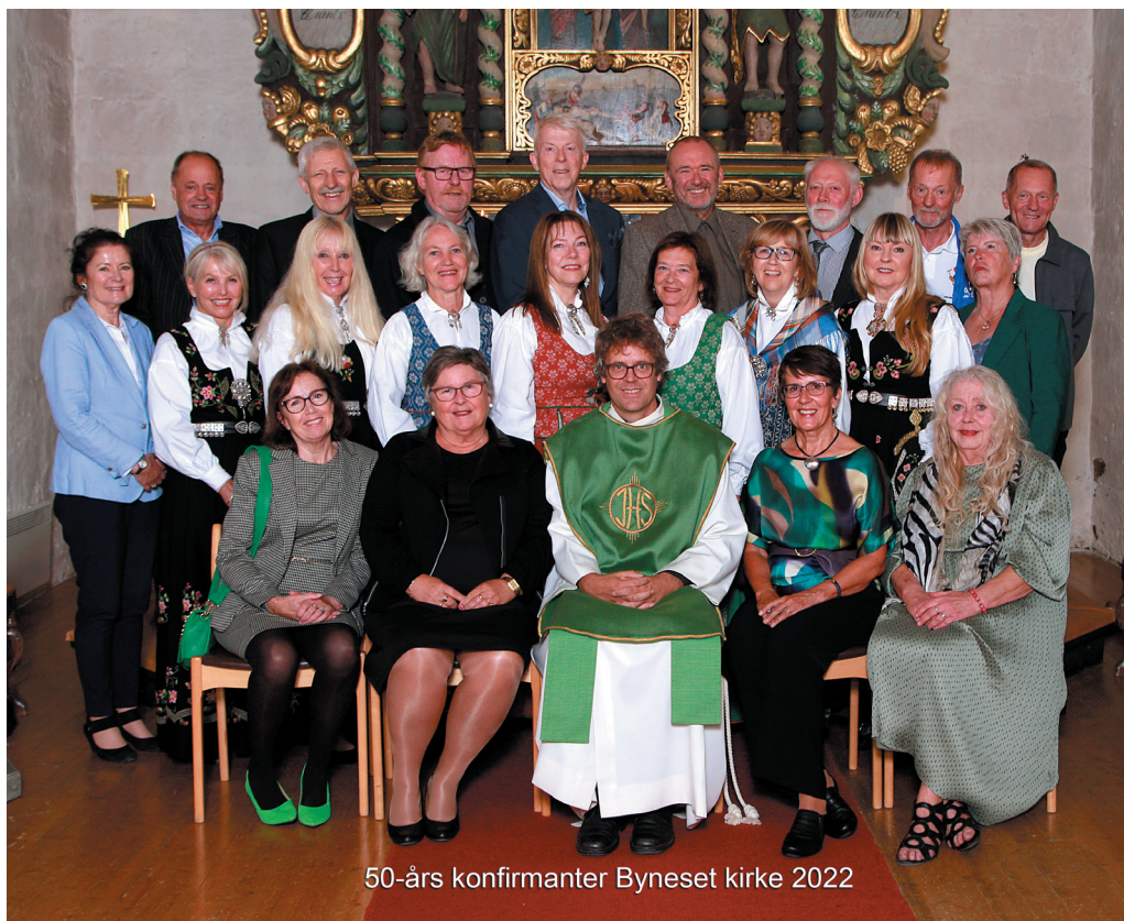
50-års konfirmanter Byneset kirke 2022