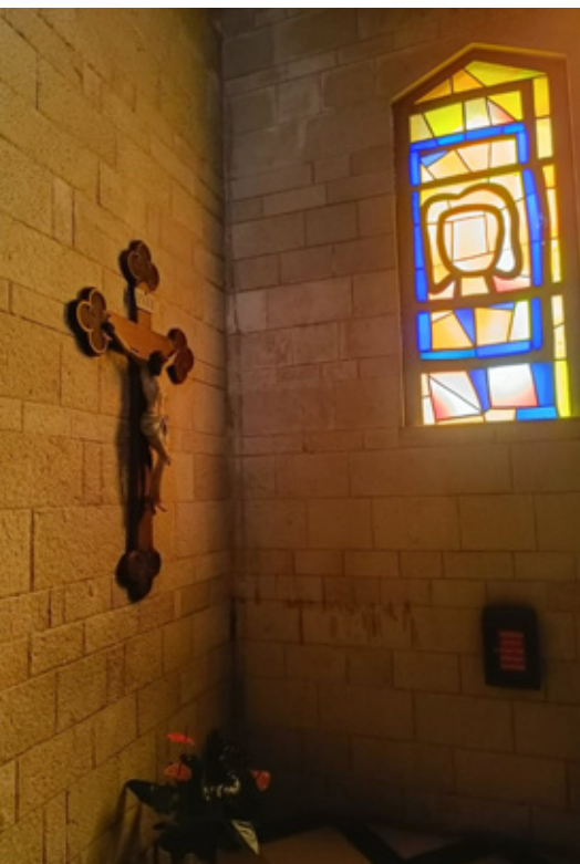
Mariabilde i glass lyser ned på den korsfestede Kristus. Motiv fra bebudelseskirken i Nasaret.

Slik begynner en sang jeg husker fra min barndom. Vi sang denne sangen fra julemusikalen «Den store kongen». Den ligger på Spotify og gir dyp julestemning! Vi var både barnekor- og tenåringskorgrupper fra alle stedene på Nordmøre og reiste rundt og sang i førjulstida. Julestemningen var på plass, med jevnt snøfall og kulingbyger som ristet i lysekronene og takbjelkene i kirkene. Mange nordmøringer har sterke og vakre minner om akkurat denne musikalen.