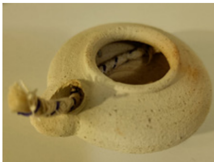
Oljelampe fra Nasaret. Olivenolje av simpleste kvalitet fra den siste pressingen ble brukt i lampene. Vi har vanskelig for å tenke oss hvor mørkt det faktisk var på den tiden.

Nasaret var en svært liten by på den tiden den unge Maria levde. Det bodde bare drøyt hundre mennesker der. Men de hadde en liten synagoge, og minst én tømmermann. Josef hadde slekta si i Betlehem, like sør for Jerusalem, men hadde bosatt seg her. Kanskje han arbeidet med husbygging i den større byen Sepphoris som lå en drøy times vandring unna? Det var gjerne lettere å finne arbeid i de store prosjektene der. Nasaret lå ulendt og avsides til. Ingen romerske soldater brydde seg om denne lille landsbyen oppe i ei åsside i Galilea. Når vi også vet at folk den gangen var ganske spede og småvokste, voksne kvinner gjerne 150 cm og menn 160, så skjønner vi hvor lita både stova og Maria selv var. Hun var jo bare tenåringsalder da engelen kom på besøk. Vi hører ikke mer om Josef etter episoden med Jesus som tolvåring i templet. Kanskje han hadde skadet seg i arbeidet eller til og med omkommet? Det var ganske vanlig. Jesus, som var den førstefødte, bor i alle fall hjemme ganske lenge, noe som indikerer at han overtok rollen som mannen i huset. Jesus følger sin mor Maria til bryllupet i Kana, et par timers vandring fra Nasaret. Da har han allerede fått de første disiplene og blitt døpt av Johannes Døperen i Jordan. Der i Kana gjør Jesus sitt første under. Maria har hatt troen på ham lenge, helt siden englebudet den hverdagen hjemme i sin