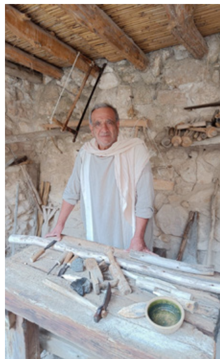
En rekonstruksjon av et snekkerverksted i Nazareth Village med tidsriktig verktøy og utstyr. Tømmermann kan oversettes med bygningsmann, for de jobbet like mye med stein.

I høst fikk jeg anledning til å besøke Nasaret og Kapernaum og flere andre steder. Det er mange som har gjort det samme, og fått en opplevelse av å komme nærmere både Maria og Josef og Jesus selv. Jesus kom fra denne lille byen, født inn i en liten familie, av småfolk fra fattige kår i en utkant av verden. Sønn av den evige Gud, den lovede Messias, Fredsfyrsten, Herrens lidende tjener, verdens lys og det levende vann. Som en fattigslig vandrepredikant stiger Guds herlighet fram på jorden.