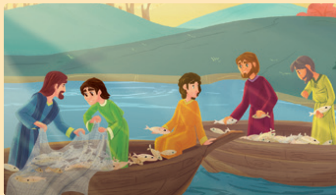
Tegning: Claudia Chiaravalloti