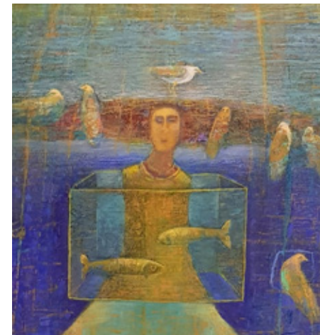
Maleriet «Listen to the voices» av Gerd Lorås

«Det trenger ikke å være blå iris, Det kan være ugress på en øde tomt, Eller noen små steiner. Bare følg med, Sett sammen noen ord, Og ikke prøv å gjøre dem innviklet. Dette er ikke en konkurranse, Men en døråpning inn til takken, Og en stillhet Der en annen stemme kanskje, Vil snakke.»