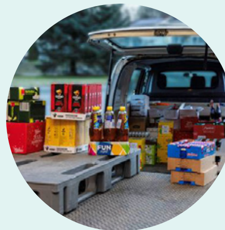
Det pakkes og kjøres ut varer fra Matsentralen.