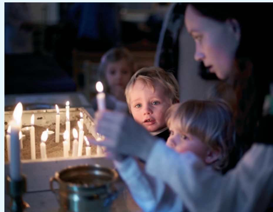
Å tenne lys er alltid like fint og spennende.