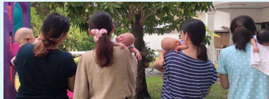
Mødrene på Nådehjemmet har blitt ekstra sammensveiset under koronaen.

på landsbygda. Mange steder i Bangkok ble det også satt opp matskap der de som hadde noe å avse, kunne donere tørrmat, og de som trengte det, kunne hente seg mat gratis. Skulle tro de hadde vært i Ila og lært av vår egen Øystein Digre.