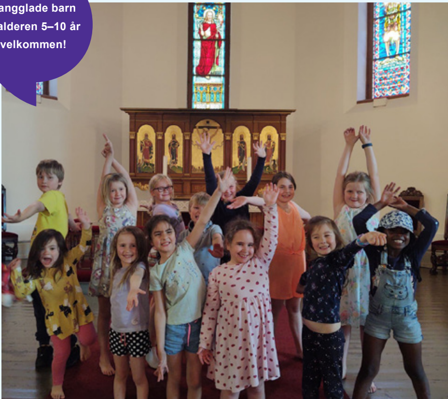
Det er livlig på øving med barnekoret i Ilen kirke!

Sangglade barn i alderen 5–10 år – velkommen!