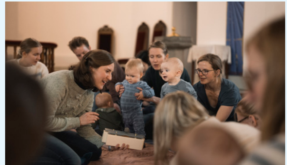
Babyene synes lyden fra xylofonen er spennende!

Jeg må ofte sitte en stund i kirkerommet etter at jeg har hatt babysang. Her foran alteret har vi møttes, små og store, og det lille barnet har vist meg hvordan jeg kan sitte her og være Guds barn.