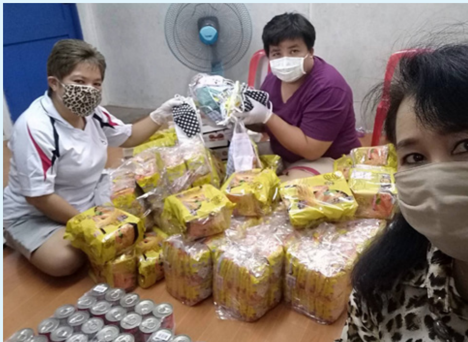
Det lages 300 pakker med mat og husholdningsartikler til utdeling i området rundt Lovsangshjemmet.

og kjøpte mat. Det ble laget 300 pakker med tørrmat og husholdningsartikler. Sammen med en ungdomsgruppe fra en internasjonal skole delte de ut pakker til alle familiene i området. Den lutherske kirken, som Ilen menighet samarbeider med gjennom NMS, hadde for øvrig flere matutleveringer både i Bangkok og