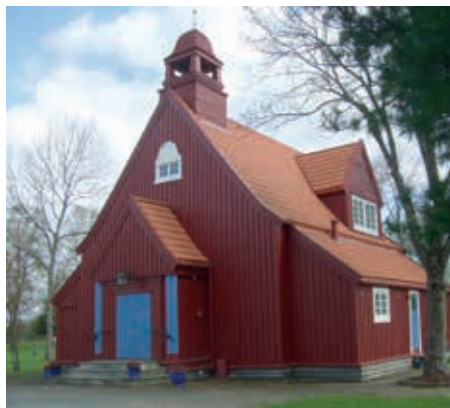
Stavne kapell som vakkert seremonirom