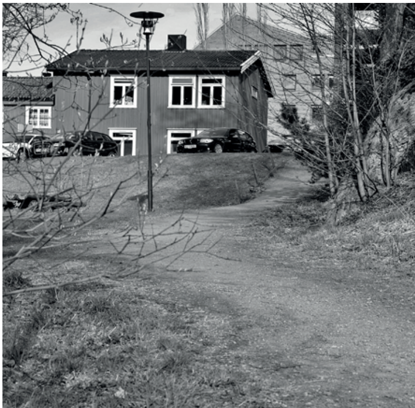
Bilde: Finn Nilsen

Kilde: «Steder og navn i Trondheim» og «Trondheim byleksikon»