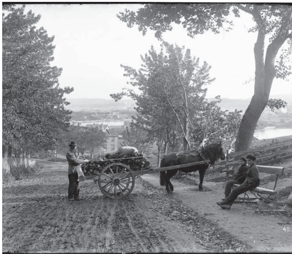
Steinberget anno 1890.

Forstaden Ila og Bymarka overført til vår Frue. Ila/Ilen blir eget prestegjeld og sokn