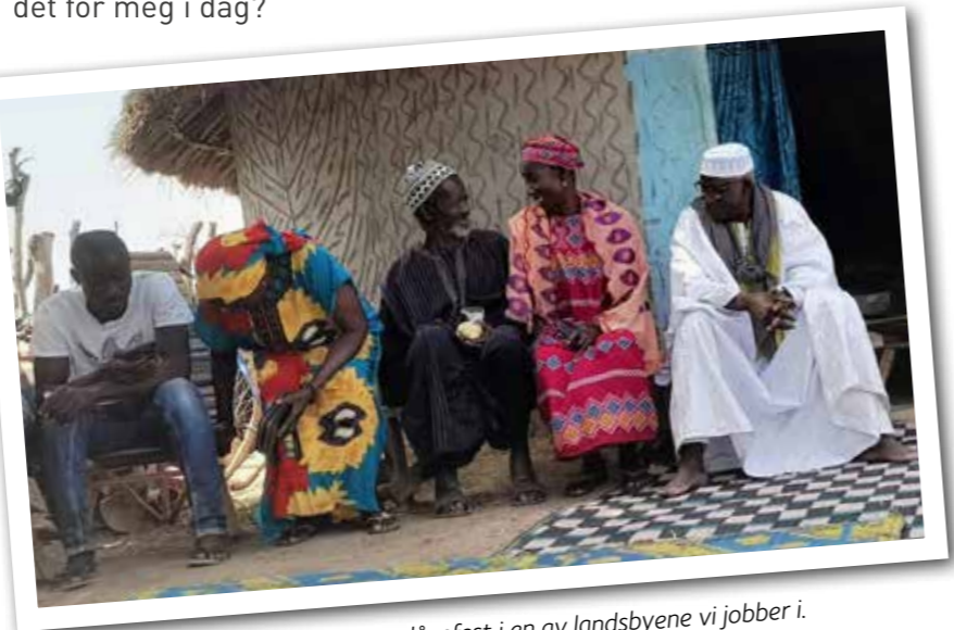
Lokale i en dåpsfest i en av landsbyene vi jobber i.

Pionermisjon kan være frustrerende fordi resultatene er vanskelig å se og kommer ofte lengre framme. Denne høsten har vi imidlertid flere konkrete, positive erfaringer som har vært oppløftende: ICDP-opplæringen er endelig i gang med positive tilbakemeldinger fra deltakerne. Vi har begynt et samarbeid med maliske misjonærer som kommer over grensa for å fortelle om Jesus til sitt eget folk, men i et annet land. Og gjennom en av bibelgruppene våre er det nå én person som kaller seg kristen og som er tydelig på at Jesus må være Guds sønn. Det har vi ikke opplevd før i arbeidet her.