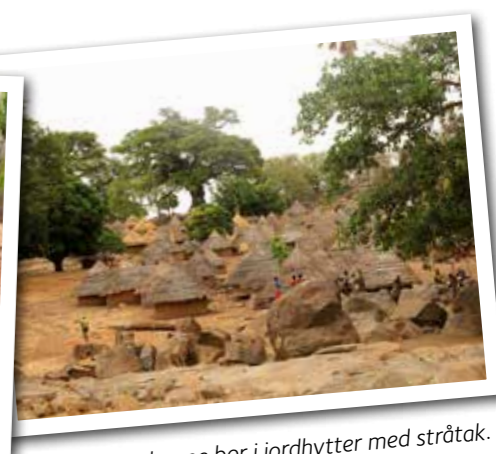
Noen av naboene bor i jordhytter med stråtak.