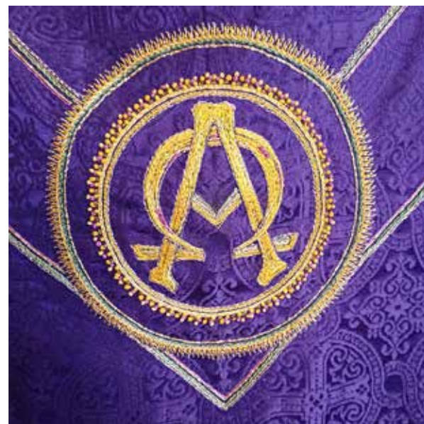
Messehagel Strinda kirke: Inger Fure

Deg være ære, Herre over dødens makt! Gleden og feststemningen fra 1. påskedag vedvarer med bruk av hvitt helt fram til pinse.