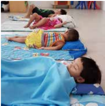
Godt med hvilestund etter en aktiv dag på barnehagen!