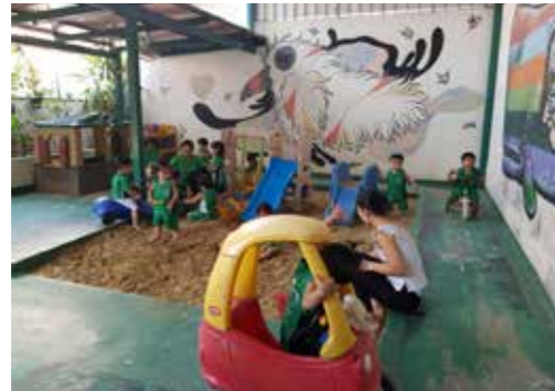
En stor sandkasse var et av resultatene av utbyggingen på Lovsangshjemmet, til stor glede for barn og voksne.