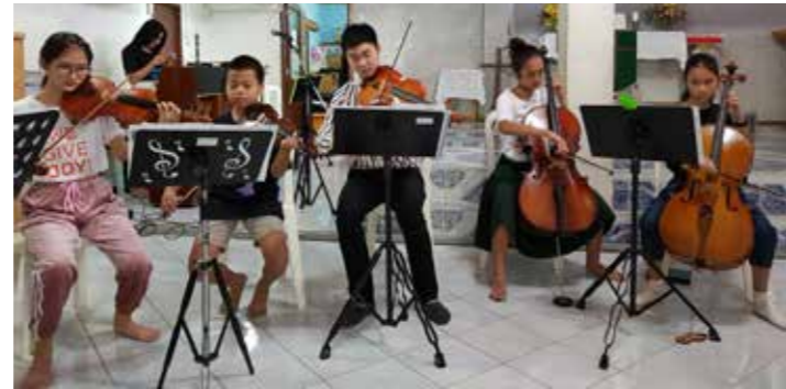
Immanuel musikkskole spilte til sangene på gudstjenesten.

På starten av 2000-tallet kjøpte Immanuel kirke bygningen som tidligere har vært politistasjon i slummen, for å bruke den til barnehage. Det Norske Misjonsselskap (NMS) ble da hovedsponsor for barnehagen. Og siden Strindheim menighet støtter NMS og har Thailand som misjonsland, er vi støttespillere for de små i Bangkoks slum.