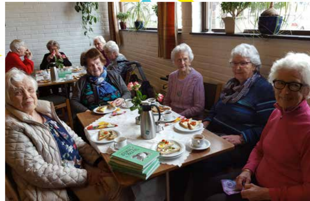
Fra hyggetreffet i kirka.