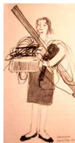
Illustrasjon fra boka