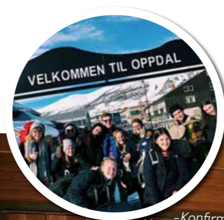
- Vi hadde besøk av Ten Sing Norway på konfirmantleiren, Denne gruppa er en del av et team som reiser rundt i Norge for å starte Ten Sing-grupper og for å inspirere til sang, lek og dans.