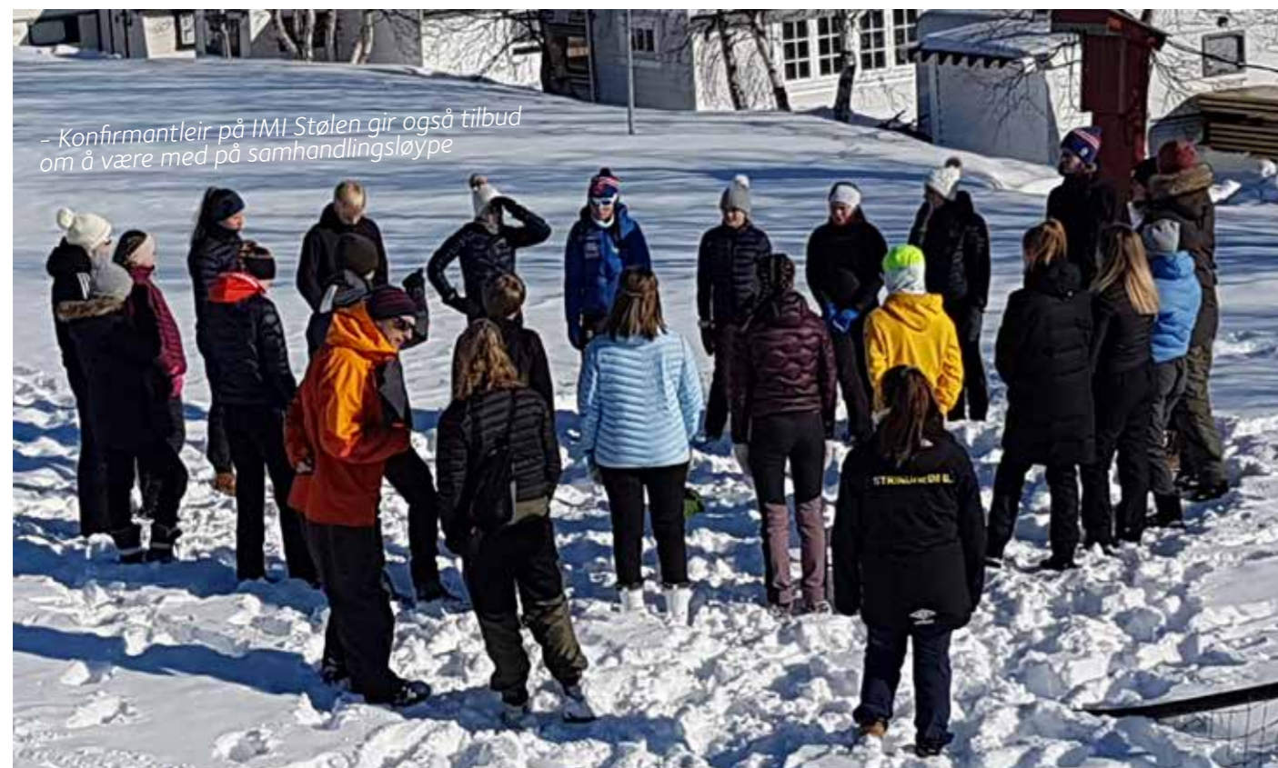
- Konfirmantleir på IMI Stølen gir også tilbud om å være med på samhandlingsløype

DET HAR VÆRT SÅ FINNT Å BLI KJENT MED DERE. JEG HAR HATT MANGE GODE OPPLEVELSER SAMMEN MED DERE I LØPET AV KONFIRMANTÅRET.