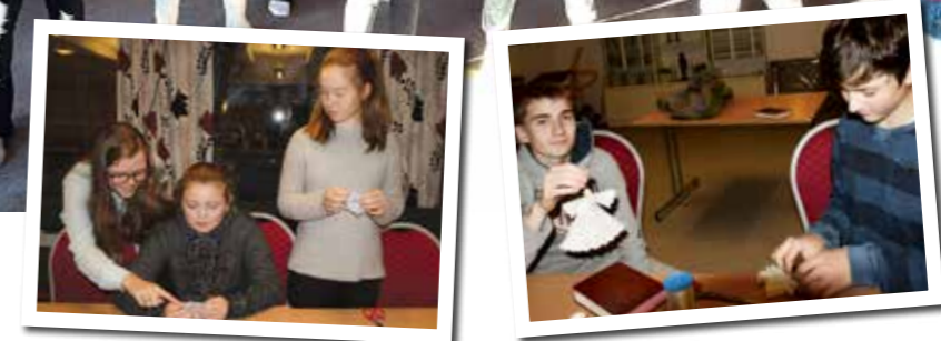
Konfirmantene lagde ting som ble solgt til misjonsprosjektet vårt

Dere har jobba konkret for en bedre verden, både da dere laga ting som ble solgt til misjonsprosjektet vårt i Thailand, jobba med bærekraftsmålene og da vi laga julemiddag for dere. Å være konfirmantleder betyr også at man må tenke gjennom mange spørsmål for seg sjøl. Hva er kristen tro? Noen av dere våga å stille det spørsmålet. Hvorfor går vi til gudstjeneste og hva er det å være forelska? Jeg håper at dere har fått anledning til både å lære og bli utfordra på om det kan være mer mellom himmel og jord.