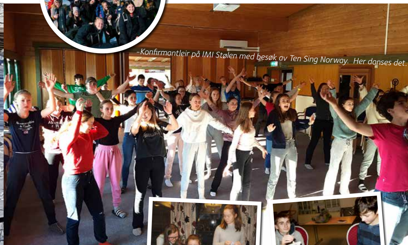
- Konfirmantleir på IMI Stølen med besøk av Ten Sing Norway. Her danses det.