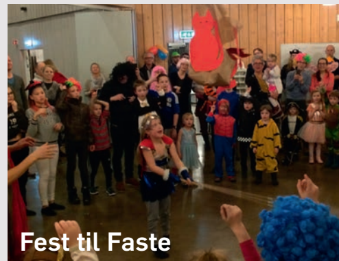
Fest til Faste

8. februar ble inngangen til fastetiden markert med "Fra fest til faste" i Byåsen kirke. 160 små og store utkledd med festlige kostymer deltok på gudstjeneste og karnevalet. Det var flott av sang av Byåsen pre Soul Children og Byåsen Familiekor. Mye lek og fest, som nådde sitt høydepunkt da Pinjaten sprakk og gulvet fyltes med sjokolade.