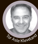
Tor Asle Kleveland