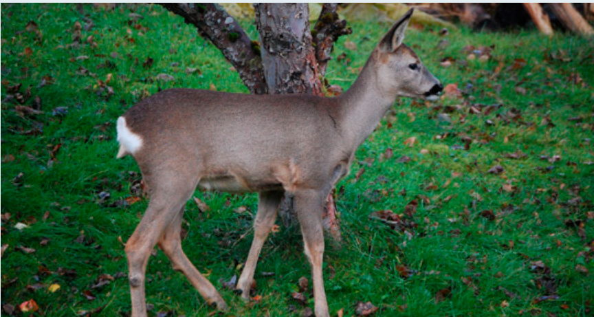
Genetisk er det lite forskjell på epletre, rådyr og mennesker.

Men Frans hadde egentlig mer rett enn han selv visste. Vår tids genetiske kunnskap bekrefter at alt livet på jorda er i slekt. Rent genetisk er det liten forskjell på meg og på rådyret og epletreet utenfor vinduet mitt. Og Frans understreker særlig vårt slektskap med jorda ved å kalle henne både søster og mor.