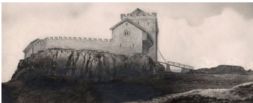
Sverres borg ha sett ut, men ellers vard et nok ikke mange borger på Byåsen.

Noen av oss går ofte og lurere på stedsnavn i nærmiljøet. Nyborg, Dyrborg, Hammersborg, Cecilienborg, Marienborg, - hvor mange borger var det egentlig på Sverresborg? Og vi som har adresse Dickkaunsvingen, får stadig spørsmål om denne Dicken. Med «c» til og med. Veistumpen er en blindvei som ble til overs da man på 80-tallet la om Breidablikkveien og skar den direkte ned fra Auneveien til den veien som den gang het Hofstads vei på Breidablikk. Stedsnavn bærer ofte på historier som det kan være artig å nøste litt opp i.