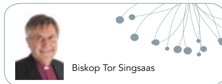
Biskop Tor Singaas