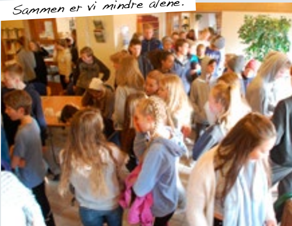
Sammen er vi mindre alene.