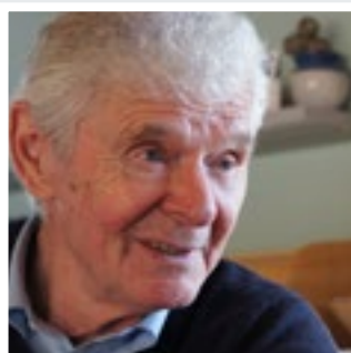
8 Kleveland vil gi tilbake