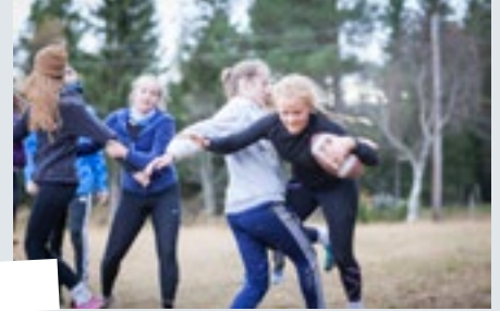
Her er det livsglede og utfoldelse.