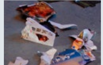
Men noen ganger går alt i stykker.

Glimt fra en dag på konfirmantleiren på Mjuklia for Sverresborg og Ilen