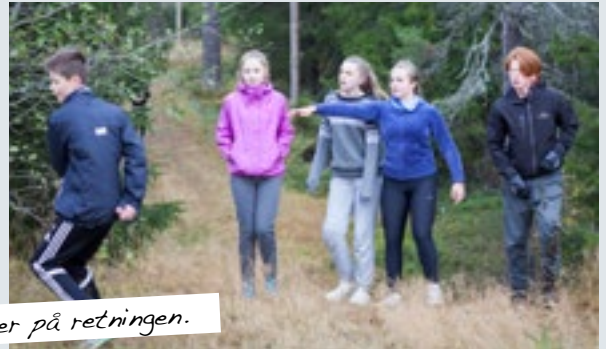
Man kan være usikker på retningen.