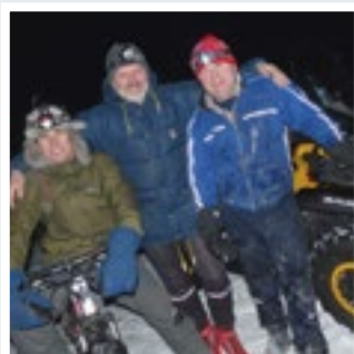
4 Blyberget frileik