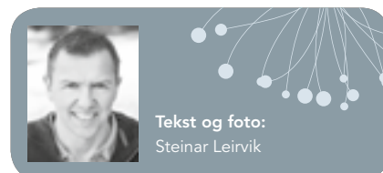
Tekst og foto: Steinar Leirvik

– Det handler om nestekjærlighet! Å bli flinkere til å se hverandre. Sammen må vi ta ansvar for at flere har det bra, med mer fokus på verdier – enn det materielle.