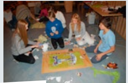
Sammen kan vi skape noe nytt av det som ikke ble som vi ønsket.