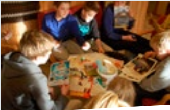
Vi prøver å uttrykke det gjennom å lage en skapelseskollasje.