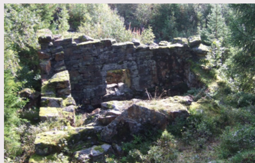
Øvre mølleruin 2009.