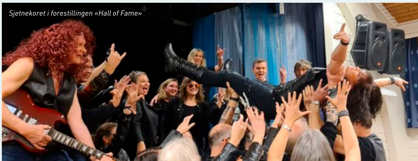
Sjetnekoret i forestillingen «Hall of Fame»

- NM høsten 23, der vi fikk gode tilbakemeldinger.