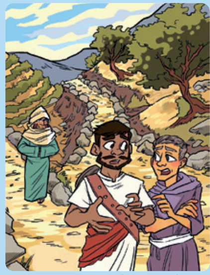
Tegning: Faye Simms

Bruk Det nye testamentet i Bibelen for å komme frem til løsningsordet.