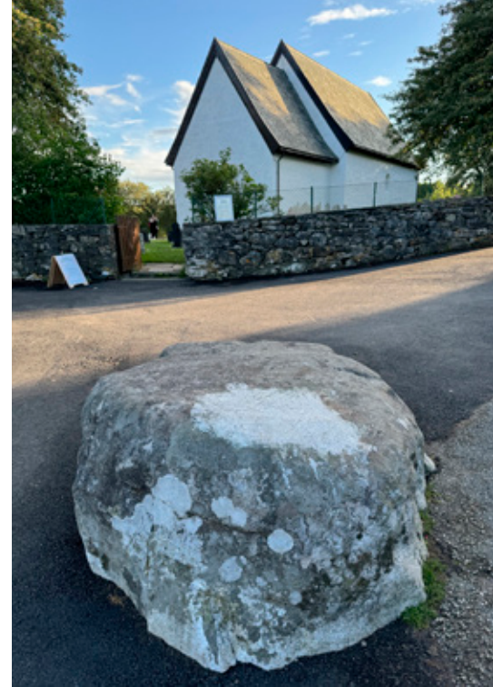
Tingsteinen. Her sto kanskje Olav den hellige og talte. Moster gamle kyrkje i bakgrunnen.

Olav den hellige steg i land på Moster i 1024 og holdt ting. Her ble kristenretten innført. Korset ble reist i 1924 til 900 års-jubiléet.