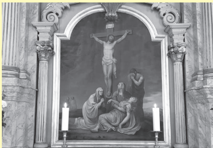
Bilde: Altertavle Sør Fron.

Jesus skal snart tas ned fra korset og legges i graven. Og kvinnene ved korset skal snart kikke inn i gravens mørke og tomhet, fylt av sorg, omsorg og kjærlighet. Men hvor er Gud i alt dette meningsløse? Finnes det håp?