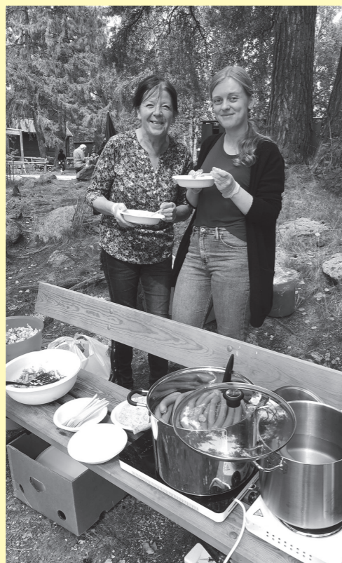
Diakonimedarbeidere ordner lunsj