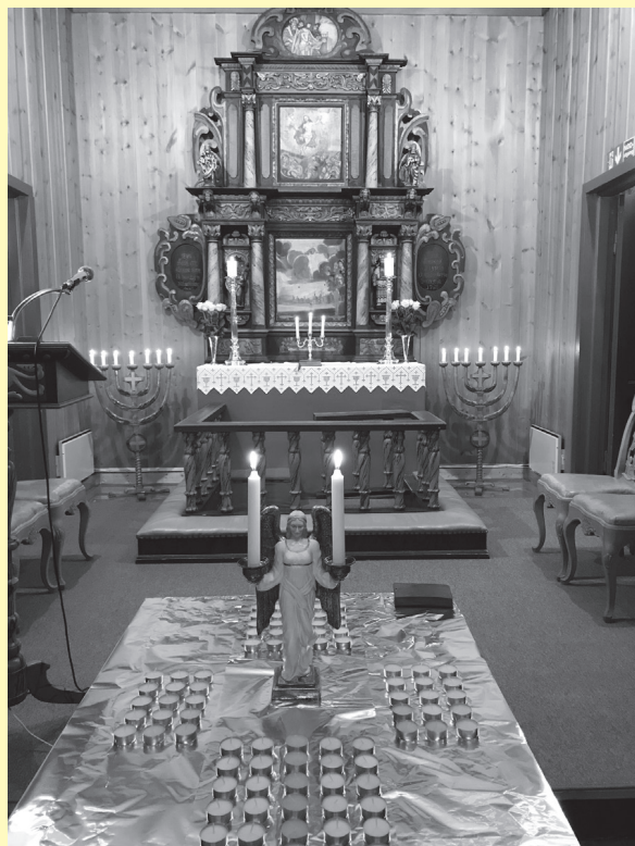
Klart for Alle-helgen i Tørberget kirke.

Vi tenner lys, i kirka, på kirkegården, hjemme, - for å minnes og i håp!