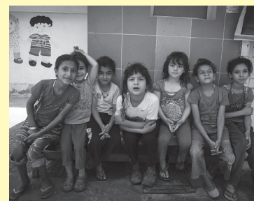
Barn fra søppelberget i Kairo.

Stefanusbarnas motto er: «I can – jeg kan!» Stefanusalliansen har samarbeidet med Mama Maggie og Stefanusbarna siden 2005.