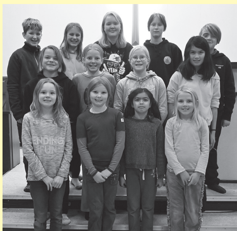
Regnbuen bidrar med vakker sang på Luciamessa.

Trysil kirke kl 11. Nordre Trysil kirke kl 18