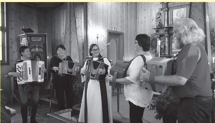
Trysil 2radern spilte