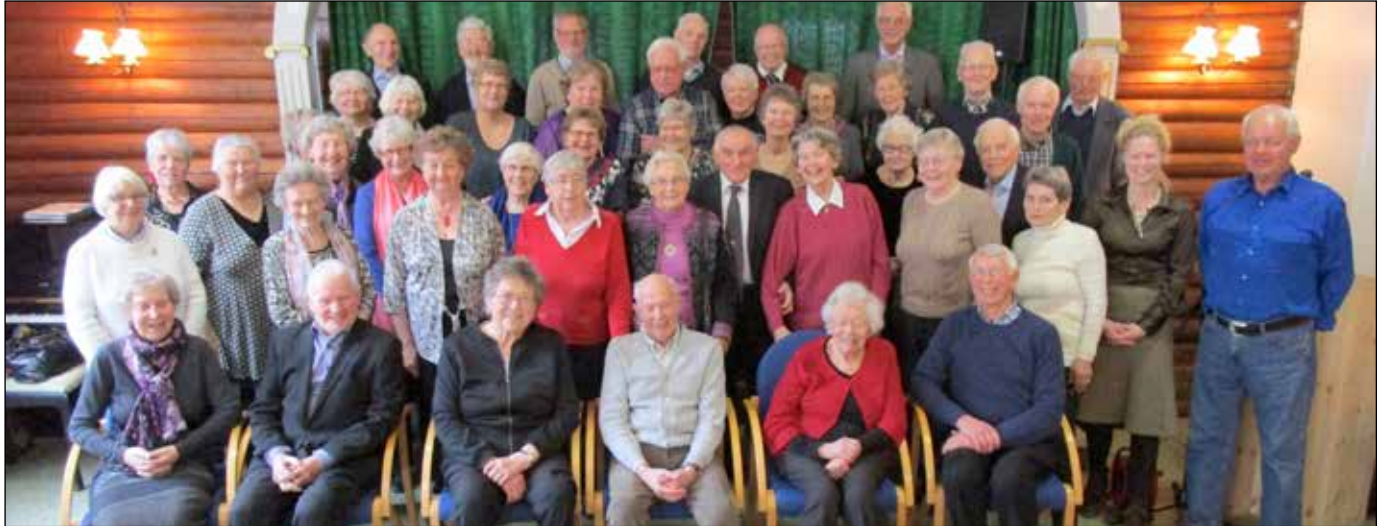
Bilde av mange av de som deltok på jubileet.

Beverting ble det selvsagt også og med kjøpte snitter og bløtkake, fikk festkomiteen en litt lettere jobb enn vanlig, ettersom de slapp å smøre snittene på forhånd.