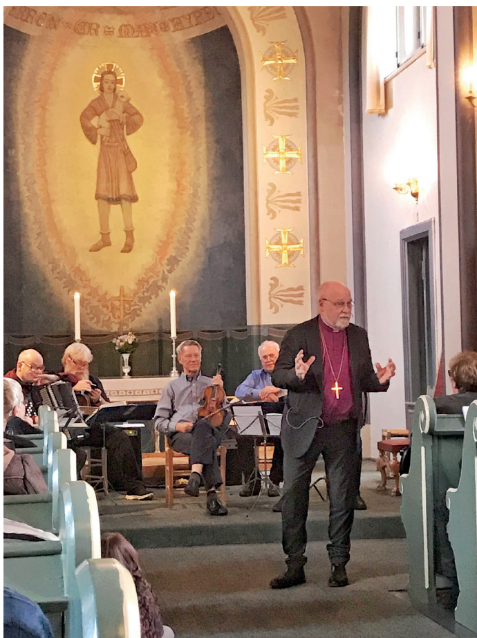
Biskop Atle Sommerfeldt

Takk til alle med smått og stort som bidro til at visitasen ble en flott opplevelse både for biskopen og menighetene!