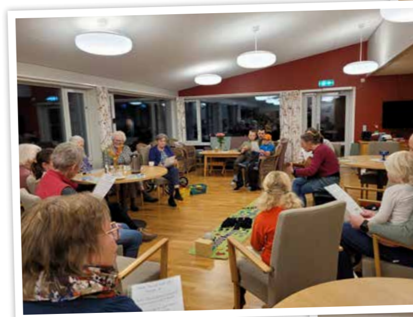
Samlingstund med song og forteljning.