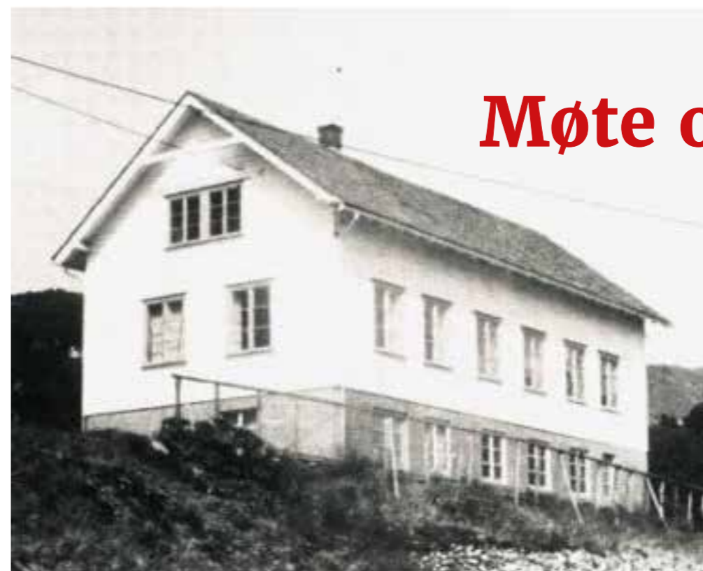
Bygget «Betel» er eigd av Ulvik indremisjon.