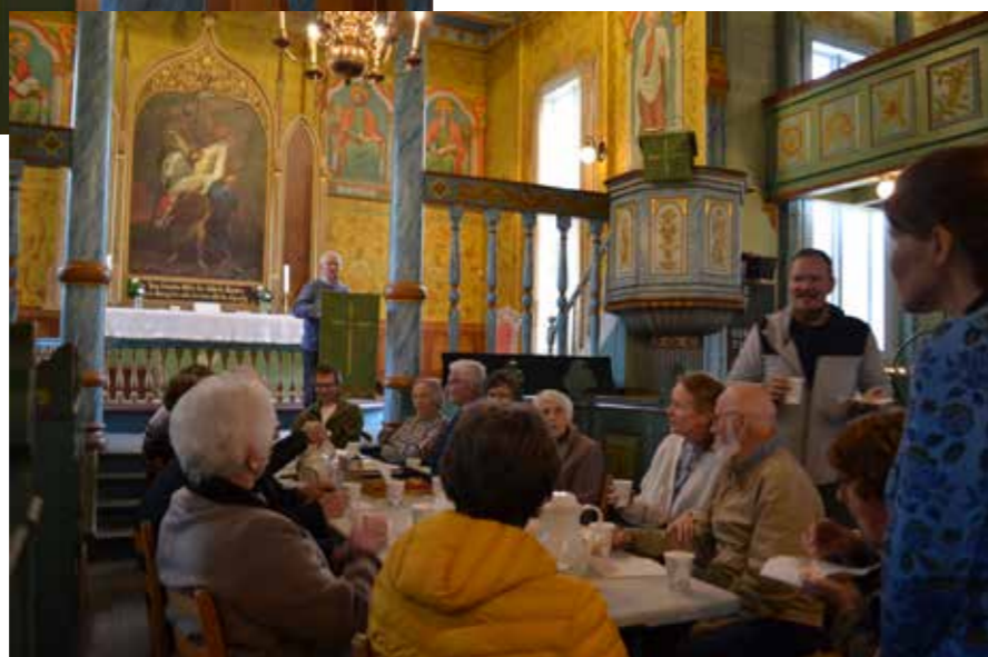
Kyrkjekaffi og minnemarkering.