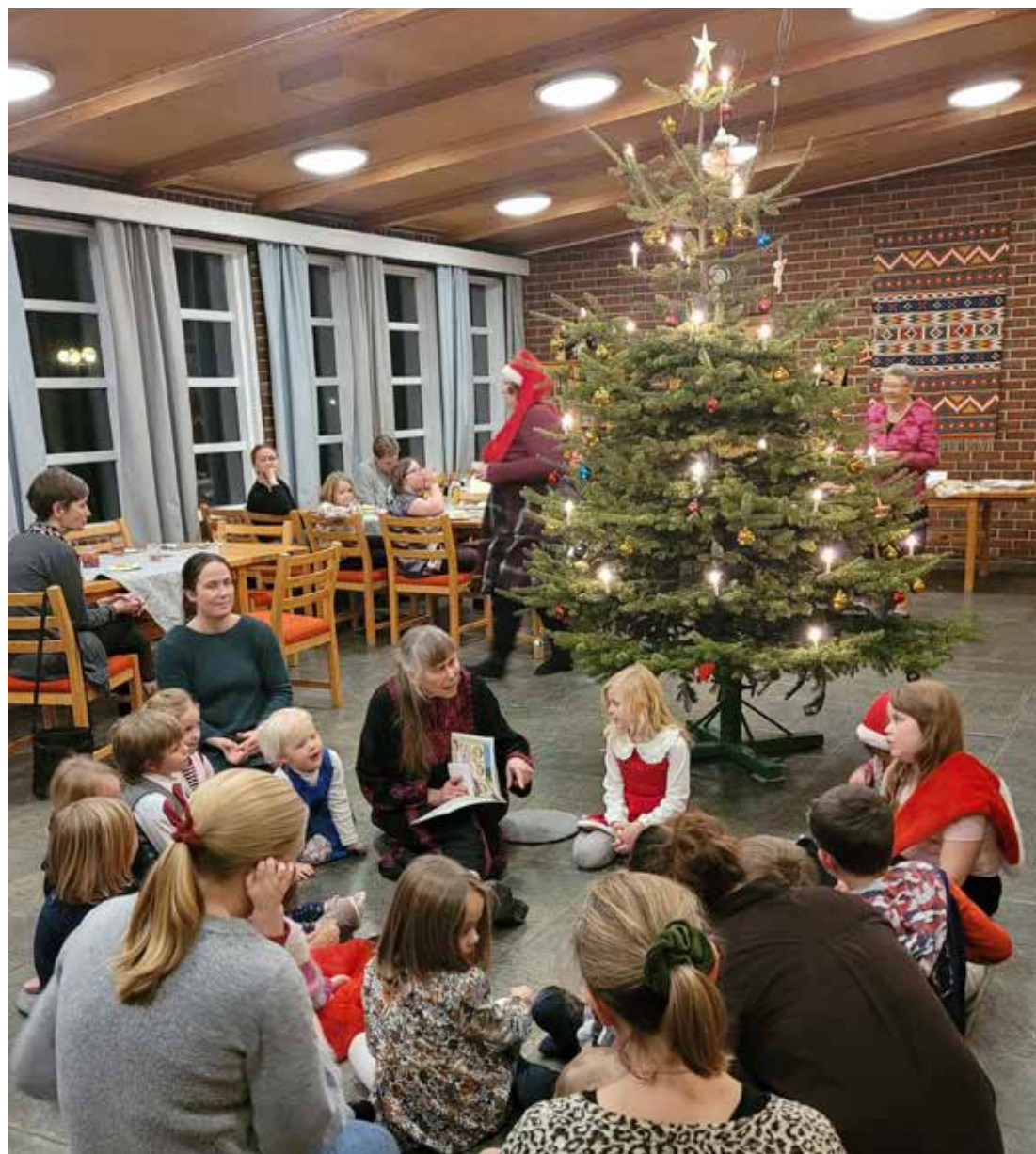
Biletet er frå joletefest på nyåret 2023.