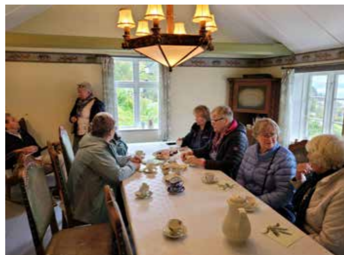
God prat i stova på Indre Bjøtveit Gard.