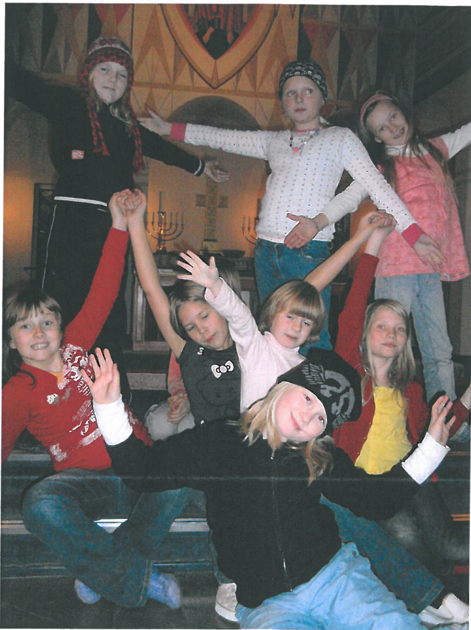
Barnegospel D'Kor Februar 2009