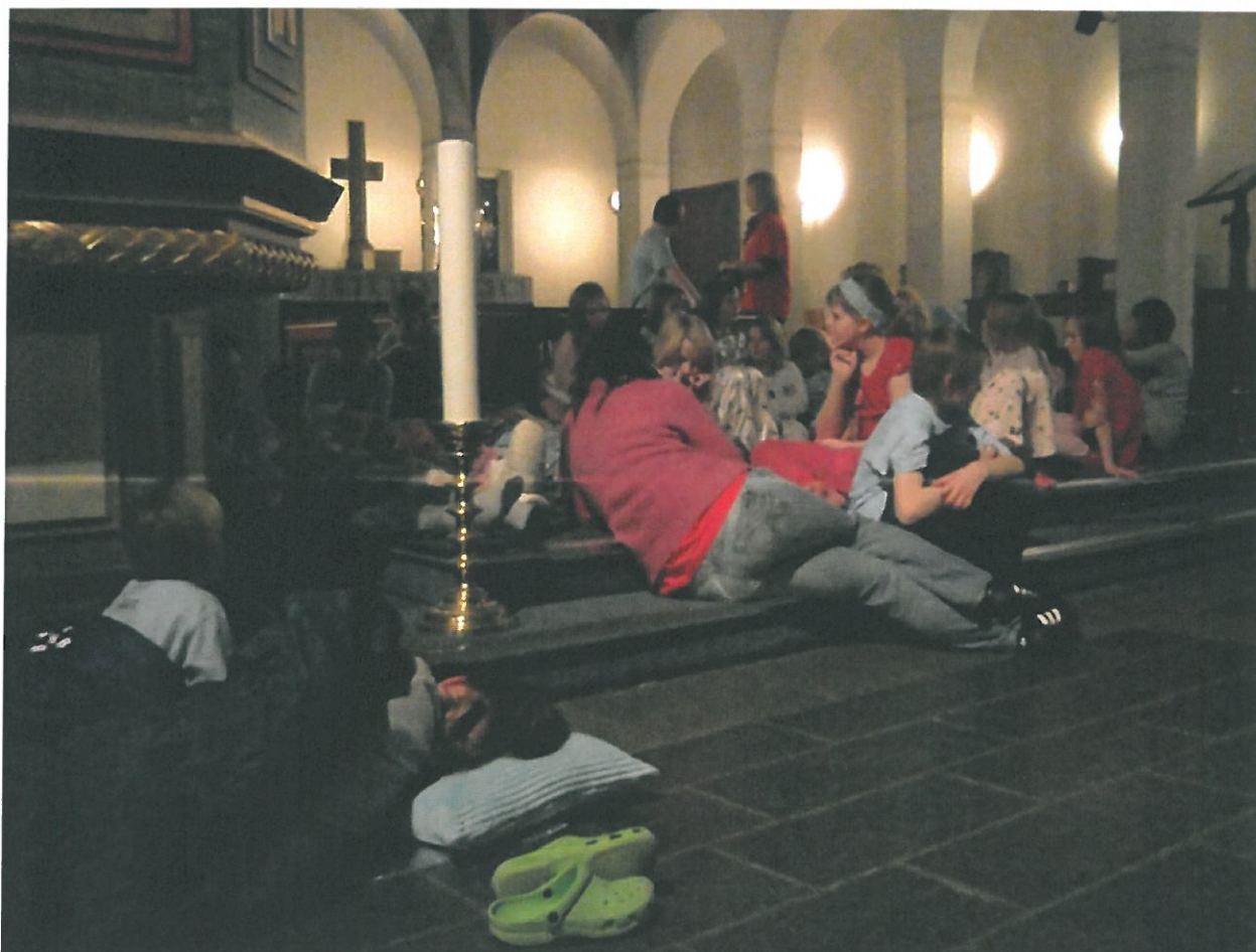
Lysvåken november 2009

62 konfirmanter startet i høst sin konfirmasjonstid. De har vært på leir og deltar i storgruppeundervisning. Konfirmentene har kunnet velge gruppe de kan følge gjennom hele året. Disse er Journalistgruppe, Kunstgruppe, Speidergruppe, Changemakergruppe og Rømmkolling-gruppa. Disse gruppene blir ledet av frivillige og ansatte. Av frivillige er flere tidligere Milkere i menigheten.