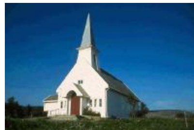
Vestre Jakobselv kapell