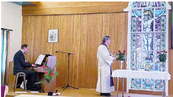
GUDSTENESTE: Siste gudsteneste, 25. februar.