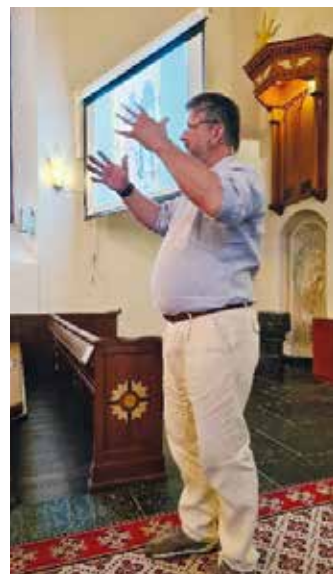
ENGASJERT: Ein engasjert føredragshaldar i Vaksdal kyrkje.

Tekst/intervju: Frode Kvamsøe og Thor Olav Gullbrå