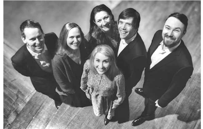
TABULA RAS: Tabula Rasa held konsert på Dale.