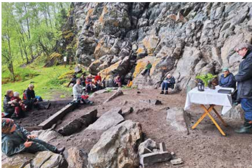
SKIPSHELLEREN: Under helleren sit me tørt uansett ver.

Nyleg kom ein fin gjeng av årets åtteåringar til Vaksdal kyrkje for å bli tårnagentar. Fyrst måtte alle seia eit passord, for å koma fram til der dei fekk agentkortet sitt – med eige fingeravtrykk sjølvsgagt!