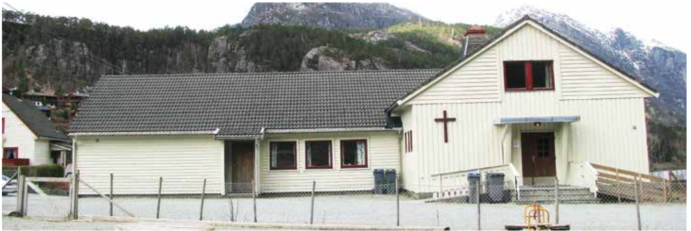
SLUTT: Stanghelle bedehus.