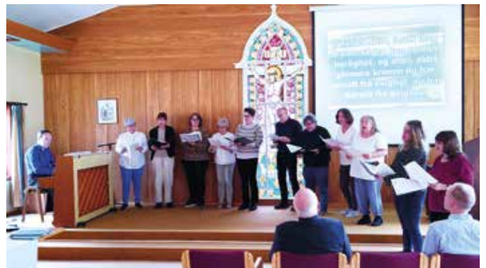
SISTE MØTE: Stanghelle bedehus 8. mai 2024. Kilden syng.