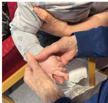
GENERASJONSSONG: Vakre menneskemøte på generasjonssong!

Me har også i vår hatt samlingar i Dale bedehus og Vaksdal kyrkje, med baby- og småbornssong for born 0-2 år på føremiddagen, og knøttesong for born 1-5 år på ettermiddagen. På Stamnes har me hatt baby- og småbornssong ein torsdag formiddag i månaden, i bedehuskjellaren. Det har vore fint å treffa både nye og kjende, og at kyrkjene kan vera ein møteplass for småborn og foreldre deira! Ekstra fine er kanskje samlingane med generasjonssong som me har hatt på Dalletunet og Vaksdal sjukeheim ein gong i månaden, det er kjekt å sjå kor mykje glede borna spreier til alle dei møter. Takk for i vår, til alle som har vore med!