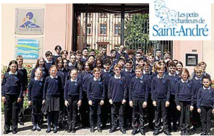
LES PETITS CHANTEURS DE SAINT ANDRÉ: Fransk barnekor med medlemmer i alderen 7 til 18 år.