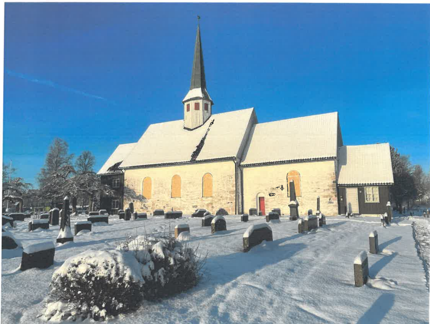
Våler kirke uten vinduer i vakker vinter sol.