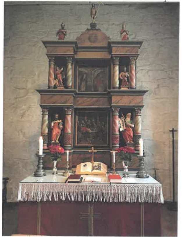
Altartavlene i Svinndal og Våler kirke

Våler Kirkelige Fellesråd er et administrativt styrende organ med selvstendig juridisk ansvar innenfor Den norske kirke. Fellesrådet består i 2022 av de som er valgt inn i menighetsrådet, en politisk valgt representant fra Våler kommune og en representant oppnevnt av biskopen i Borg. Medlemmene i 2022 var: