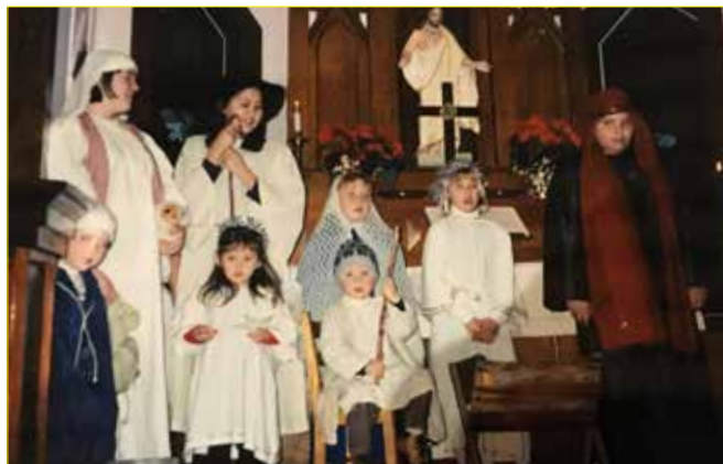
Julespelet anno år 2000: Jesusbarnet har avansert til gjetar.

kyrkjetid. Julafta er ikkje den dagen du ikkje opnar døra. Så me opna og der sto familien som skulle opptre seinare på kvelden i gudstenesta. Heile familien på fem ville gjerne stikke innom og seie god jul. Og det gjorde dei!