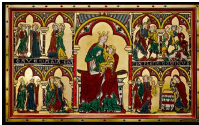
Alterfrontalen, St. Petri.

Vel, ikkje uventa var det kun eg som likte lutefisk. Ikkje 1-åringen, ikkje 3-åringen, og heller ikkje amerikaneren såg på dette som (jule)mat. Ein av ungane sølte raud saft over seg og klærne, så ringde det på døra: På julekvelden, ein time før