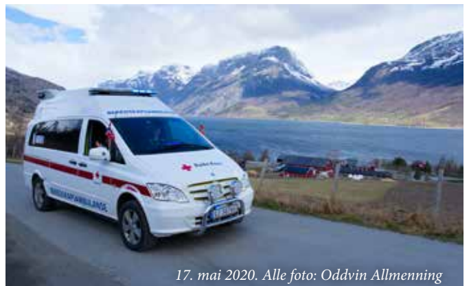
17. mai 2020.