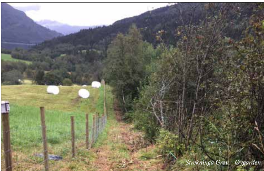
Strekninga Grøv - Øygarden