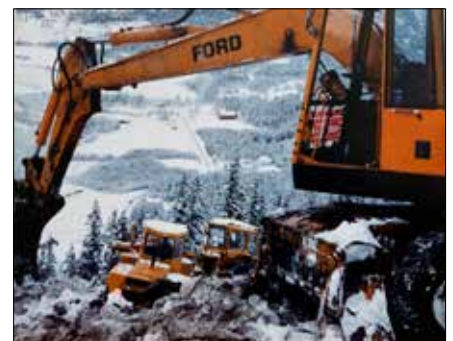
Alle bilda er frå sørre sløyfa, andre akkortene til Nils.

Nørre sløyfa ved Nye-Storsvingen, frå albumet til Ivar. På trykk på s 137 i Vangsalbumet (2019).