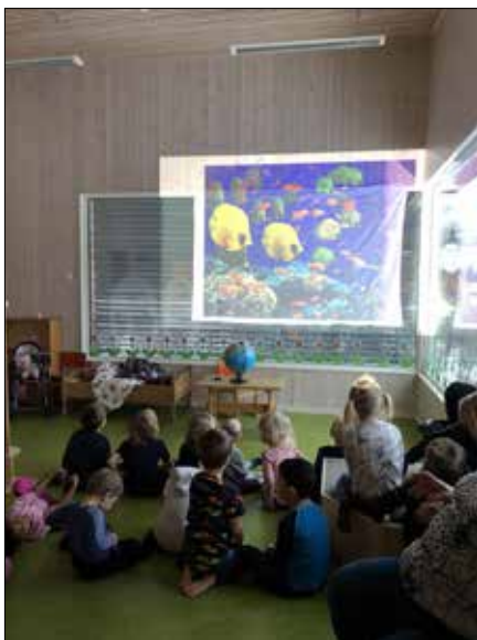
Great Barrier Reef