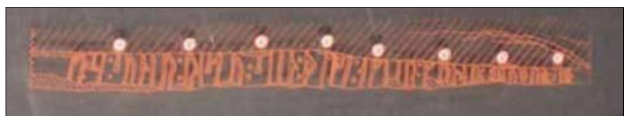
kosa : sunir : ristu : s(t)in : þinsi : af(t)ir : kunar : brufur:sun