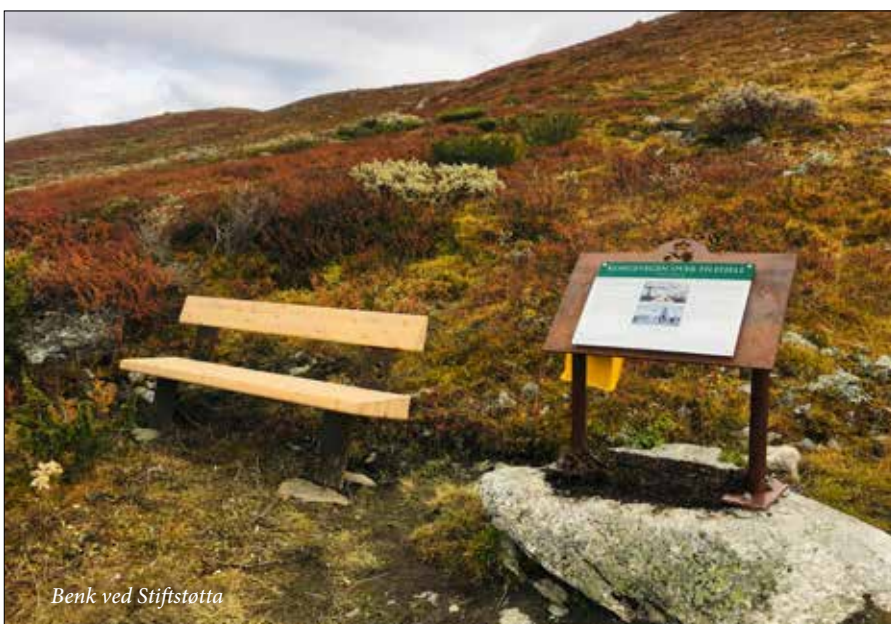
Benk ved Stiftstøtta

Første samling til hausten er 13. september. Velkomen!