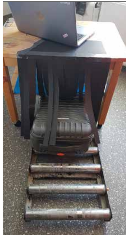
Bagasjeinnsjekk på Fredheim flyplass