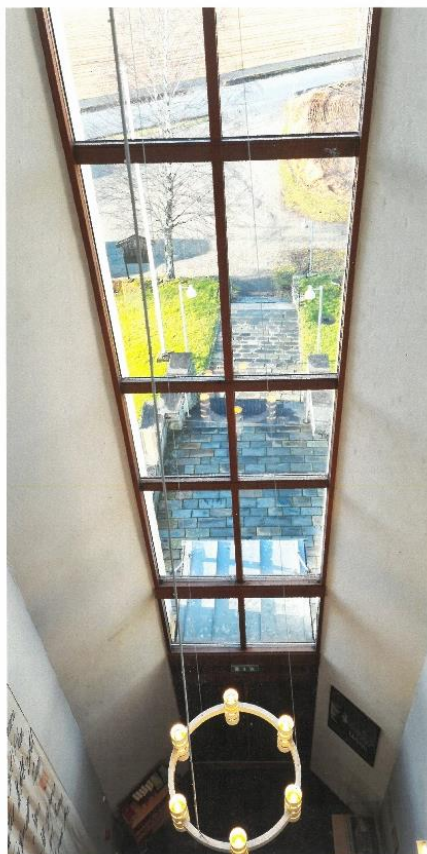
Den gamle kirken i Såner var bygget i 1880 og påtønt Kr. Himmelfartsdag 25. mai 1995. Den nye kirken ble innviet den 1. søndag i advent i år 2000.