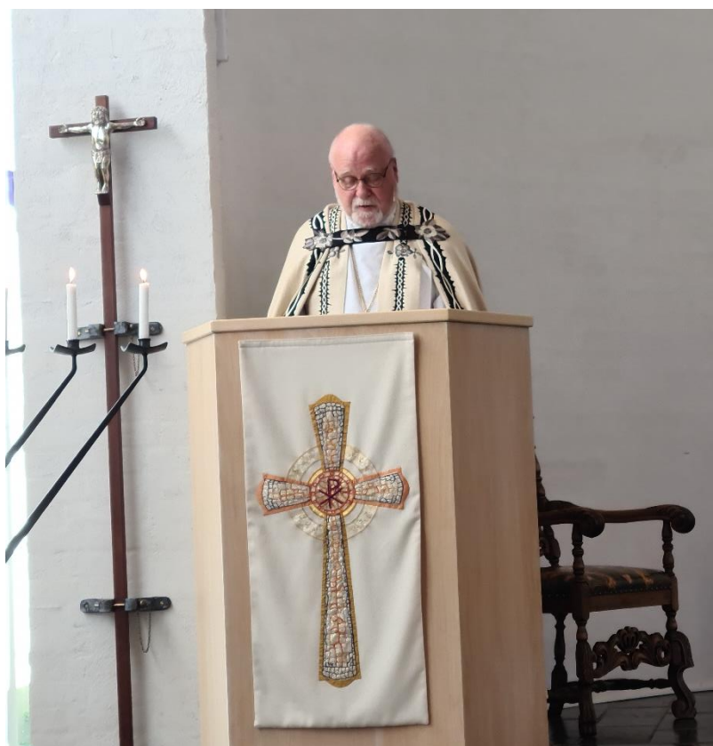
VISITASGUDSTJENESTE I SÅNER KIRKE 30. MAI.

Kveldsmesser i Son kulturkirke: Vi stengte ned månedsskiftet november/desember 2020 og startet opp igjen august 2021. Noen var fortsatt bekymret for smitte, så frammøte lå vanligvis mellom 15 og 20 stk. I desember kom nye koronatiltak, så vi måtte stenge ned igjen. Siste messe i 2021 var 8. desember.