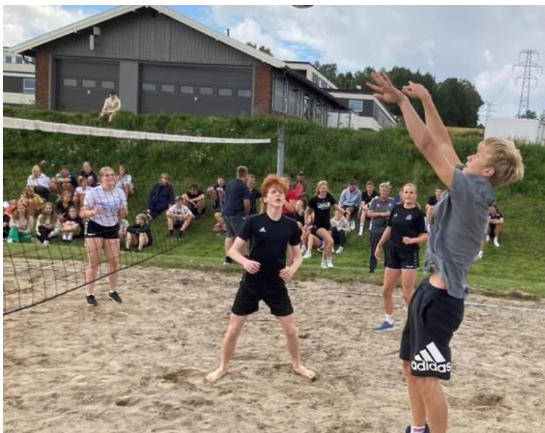
KONFIRMANTLEIR PÅ HAUGETUN

Vi har en lang tradisjon med konfirmantleir på Haugetun folkehøyskole.