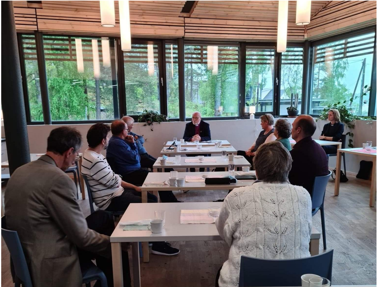
BISKOPEN I MØTE MED MENIGHETSRADET