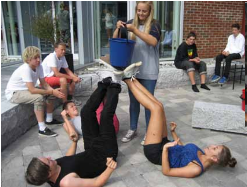
Bøttebalanse som oppgave i konkurransen Fangene på fortet