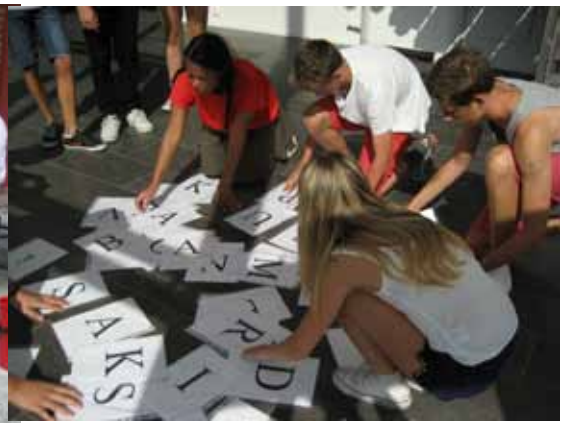
Scrabble er en utfordring til samarbeid