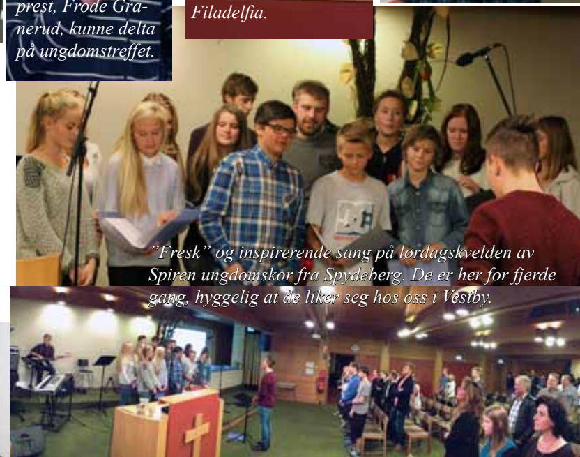
"Fresk" og inspirerende sang på lørdagskvelden av Spiren ungdomskor fra Spydeberg. De er her for fjerde gang, hyggelig at de liker seg hos oss i Vestby.