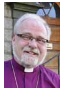
Atle Sommerfeldt Biskop