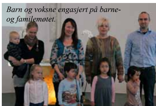
Barn og voksne engasjert på barne- og famil møtet.