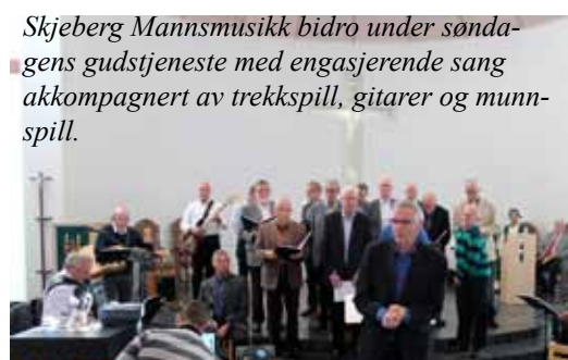
Skjeberg Mannsmusikk bidro under søndagens gudstjeneste med engasjerende sang akkompagnert av trekkspill, gitarer og munnspill.