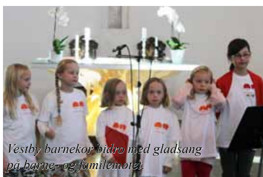
Vestby barnekor bidro med gladsang på barne- og famil møtet.