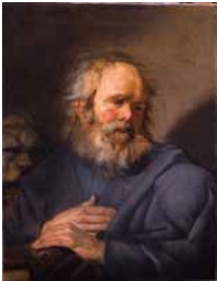
Frans Hals: Evangelisten Markus

Julen handler om Jesu fødsel. Og denne viktige begivenheten i vår kristne tro er fortalt flere ganger og på litt forskjellige måter i Det nye testamente.