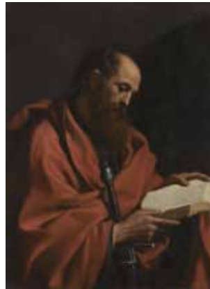
Giovanni Francesco Barbieri: Apostelen Paulus

Blant dem er Markus -evangeliet eldst. Men Markus har ingen ting å fortelle om Jesu fødsel eller barndom. Han går rett på Jesu voksenliv. Og folk flest i den antikke verden var lite opptatt av, og hadde lite kunnskap om, sin egen fødsel. Bursdag var ikke oppfunnet! Derimot var dødsdagen viktig. Den ble markert! Markus nevner heller ikke Josef. Men vi hører om Maria, Jesu mor, og vi får vite navnet på fire av Jesu brødre, og at Jesus hadde søstre.