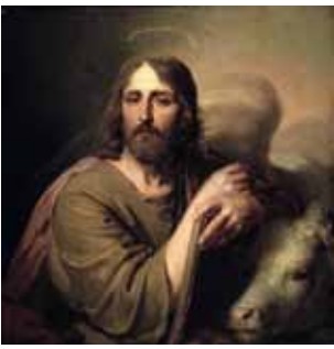
Vladimir Borovikovsky: Evangelisten Lukas