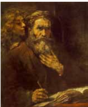
Rembrandt: Evangelisten Matteus og engelen

I bunn og grunn handler julens tekster om samme sak: At Gud ble menneske